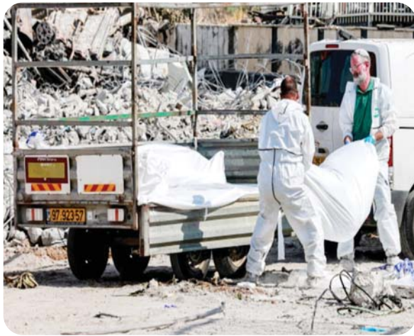
इलाके में किबुज को काफी समृद्ध माना जाता था। पढ़ाई के लिए भी आसपास के बच्चे किबुज ही आते थे। पत्रकार जैसे-

इजरायल की सेना पत्रकारों के एक समूह को लेकर प्रभावित इलाके तक पहुंची। पत्रकार एक ऐसे गांव में पहुंचे जहां करीब 70 हमास लड़ाकों ने हमला बोला था। कफार अजा चारों तरफ से खेतों से घिरा बेहद खूबसूरत कस्बा है। इस गांव के बाद से ही गाजा की शुरुआत होती है। कफार अजा भी उन 20 शहरों और गांवों में से एक है जहां आतंकियों ने जमकर तबाही मचाई। किबुज पूरी तरह वीरान नजर आने लगा। बता दें कि इस