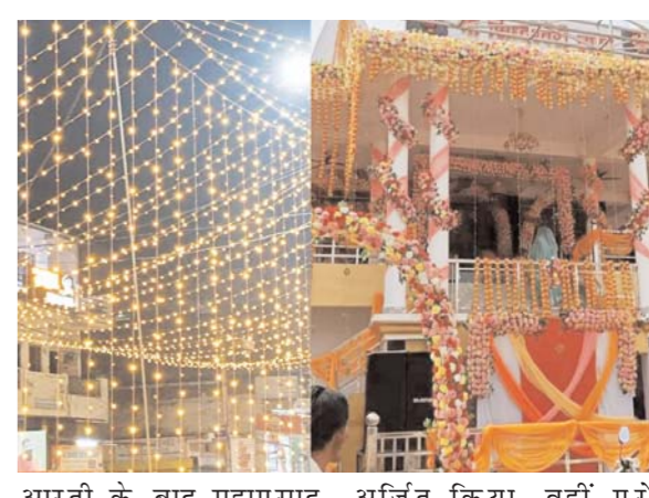
आरती के बाद महाप्रसाद अर्जित किया, वहीं पूरे मंदिर परिसर को सुंदर का भक्तों को वितरण किया गया। माता के दरबार में लाइट और फूल मालाओं से सजाया गया है।