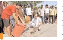
गांधीजी ने भी स्वच्छता को बताया था मानवता की दायित्व सेवा : ओम बिरला