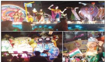
रायपुर, 1 अक्टूबर (देशबन्धु)। राजधानी में गणेश विजयन को दस दिनों के लिए शाही रतजगा देना शुरू हो चुका है।