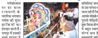
रायपुर, 1 अक्टूबर (देशबन्धु)। राजधानी में गणेश विजयन को दस दिनों के लिए शाही रतजगा देना शुरू हो चुका है।