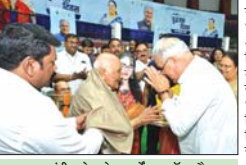
■ मुख्यमंत्री भूपेश ने बुजुर्गों का शौल और शीफट देकर किया सम्मान ■ बुजुर्गों को 825 सहायक उपकरणों का किया गया वितरण

है कि इस हेल्पलाइन सेंटर के माध्यम से हम बुजुर्गों को मदद कर पा रहे हैं। मुख्यमंत्री ने बताया कि बुजुर्गों के स्वास्थ्य को देखभाल के लिए राज्य सरकार द्वारा सियाज ज्ञान केंद्रों के माध्यम से बुजुर्गों को संचालन किया जा रहा है। प्रदेश के आयुर्वेदिक अस्पतालों में भी बुजुर्गों के लिए विशेष औपचारिक और पंचकर्म सेवाएं दी जा रही हैं। राज्य में भव्यतरि जैनेतिक मेडिकल स्टोर्स में 72 प्रतिशत तक कम कीमत पर गुणवत्तापूर्ण दवाई उपलब्ध कराई गई है। इस योजना का लाभ भी हमारे बरिष्ठ नागरिकों को मिल रहा है।