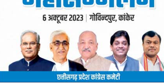
छत्रीसगढ़ प्रदेश कांग्रेस कमेटी