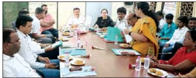
महासमूह, 5 अक्टूबर (देखावन्तु)। शासकरीय महाप्रभु बहाभावाय