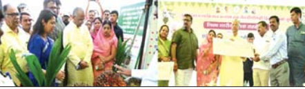
गुहमंडी जिला स्टाडी कृषक सखोलान में हुए टागिल