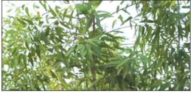
■ प्रति एकड़ 75 हजार से डेढ़ लाख तक की आमदनी