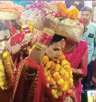
जगदलपुर, प्रतिस्पर्धी की तरह इस वर्ष भी किलर रमनाज के द्वारा अग्रश्रावणा विचारकाल नवरत्रि की पूर्व संस्कार पर अंत देकरपी अंतर में पहुंचकर पूर्व विधि विधान के साथ अग्रश्रावण में पूजा अर्चना किया। किलर रमनाज के लोग अग्रश्रावण में अपने परंपरिक वेष्टम्या में शामिल हुए। जगद-जगद पर जगदक अतिशयवाणी की की गई।

सबको अपनी अधिक लगन और मेहनत से उनकी जीतने के लिए अभी से लग जाना है चुनाव को लेकर कार्यकर्ताओं से की गुलाकत