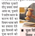
पुजा विधि को लेकर विवाद, पुजारी ने किया 4 लोगों को घायल

दुर्ग, 17 अक्टूबर (देखाभू)। पुजारी द्वारा यजमान परिवार के सदस्यों पर जानलेवा हमला किए जाने के मामले में अज्ञात दोषी के पता लगाने में पुजारी यजमान द्वारा उभरी है।