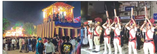
जगदलपुर, 17 अक्टूबर (देखावट)। विश्व प्रसिद्ध बस्तर दशहरा के अंतर्गत सोमवार को फूल रथ की पहली परिक्रमा हुई। बस्तर की परंपरा का निर्वहन करते हुए देर रात की माँ के मुख्य पुजारी माँ देवीश्री की छत्र की बाजे गावे के साथ माँ के सेलर केवल मावली माता मंदिर पहुँचे वर पर पूजा अर्चना...

को पूरे उत्साह के साथ बिचा। रथ के आगे ओम महिला पुलिस बॅण्ड पार्टी सुमधूर भजन की धून बजाते चल रहे थे। बस्तर की परंपरिक मूढ बियाजा देर भी माँ देवीश्री का जगामा करते चल रहे थे। चुनाव आचार संहिता के चलते इस वर्ष दशहरा के कार्यक्रम में प्रशासनिक अधिकारियों की देखरेख हो रही है। इस वर्ष माँ देवीश्री के विजय भेरे के साथ बस्तर का पहला लगभग 9:30 बजे, बस्तर प्रशासकीय अधिकारियों की परिक्रमा आरंभ हुई जो देर रात तक चली।