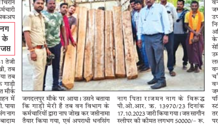
अवैध सागौन स्लीपर वगैरे 0.292 घनमीटर हाथ के साथ वन विभाग ने किया जप्त

प्रमुख नीलू मौर्य ने कहा कि हिंदू धर्म के मान्यता के अनुसार खातांतर पर माँ देवी को पूजा के समय मेहंदी लगाने बेहतर शुभ होता है। श्रवण में कहा गया है कि महिलाओं को सोलर श्रृंगार करना फिर खूबसूरती ही माँ आभारती को खुश करने के लिए 16 श्रृंगार करती हैं। इस 16 श्रृंगार में मेहंदी का अग्रमंथ महत्व है। हिंदू धर्म में मेहंदी का कामो महत्व होता है। जोहे शाही विवाह हो, या फिर कोई योग्यतर, हर शुभ काम से पहले महिलाएँ पूरा रू >>> जगदलपुर 9