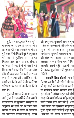
दुर्ग, 17 अक्टूबर (देखाभू)। गुजरात की संस्कृति गरबा और डांडिया को प्रेरित करता है।

गुजरात की संस्कृति गरबा और डांडिया को प्रेरित करता है। गुजरात की संस्कृति गरबा और डांडिया को प्रेरित करता है। गुजरात की संस्कृति गरबा और डांडिया को प्रेरित करता है।