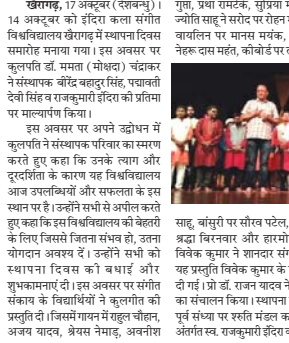
दुर्ग, 17 अक्टूबर (देखाभू)। विवि में मनाया गया स्थापना दिवस।

विवि में मनाया गया स्थापना दिवस। विवि में मनाया गया स्थापना दिवस।