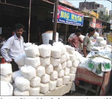
से 2350 रुपए फिटल पर बोली जा रही है। भण्डार उपलब्धता के बावजूद, खरीदी

दर उंची होने की वजह से लाई में गम्मी है। इसके बावजूद बेतार रहे, लाई में गम्मी है।