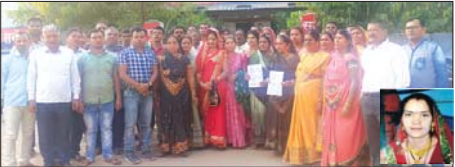
मामले की जांच एवं दोषियों पर कार्रवाई करने की मांग

थाना गंजौर पहले उनकी बड़ी बहन ने फोन कर बताया कि पति एवं सास ससुरा द्वारा मारपीट