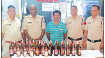
जगदलपुर, 28 अक्टूबर (देवासूची)। अग्रणी जैकन एक अशुद्ध अरुणें पापु लले रंग के डोला में अवैध शराब बिक्री करी के जाने हेतु गाडी का इतवार को नुसल पापु अनापुमारी कोतेवाली लीलापार एतरी के तुनेव एक अशुद्ध को गिरफ्तार किया। पुछताछ करे पर अशुद्ध के अपना नाम

आयतुरी म कर र एपु नुबिसो डिलमिनो बाजारा पापु का हाने बाजारा, बिसके कसुके से नीले रंग के डोला के अरुणें अवैध अंशु शराब बाँपर 5000 रुपय प्रोडाम 22 नग प्रत्येक में 650 एम्. एल. कु. ल 14, 30 लीटर कीरती 4620 एम्. एल. 100 नगाना प्रत्येक में 180 एम्. एल. प्रत्येक में 180 एम्. एल. कुल 720 एम्. एल. कोरती 480- रुके को सरकर कर, सात किया था। आरुपी के अशुद्ध धना का कोतारती में भाता 34 (2) बिबरकर धना का अरुणें वीचंद कर, का बाकी भात किया गया है। मानते में आरुपी को गिरफ्तार कर, न्यायालय के समक्ष प्रस्तुत किया।