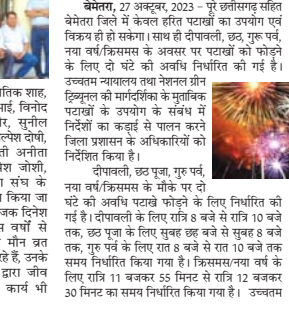
दीपावली, ठठ पूजा, गुरु पर्व, नगव/क्रिसमस के अवसर पर पटारवां को फोड़ने के लिए 2 घंटे की अवधि निर्धारित की गई है।

धेमतर, 27 अक्टूबर, 2023 - पूरे उत्तराखण्ड सहित मेघालय जिनमें केवल हरित पटारवां का उपयोग एवं विचार ही हो सकेंगा। गुरु पूजा, गुरु पर्व, नगव/क्रिसमस के अवसर पर पटारवां को फोड़ने के लिए 2 घंटे की अवधि निर्धारित की गई है। उच्चतम न्यायालय तथा नेशनल ग्रीन ट्रिब्यूनल को मारुदितिक के मुकबल पटारवां के उपयोग के संबंध में निर्देशों का कड़ाई से पालन करके जिला प्रशासन के अधिकारियों को निर्देशित किया है।