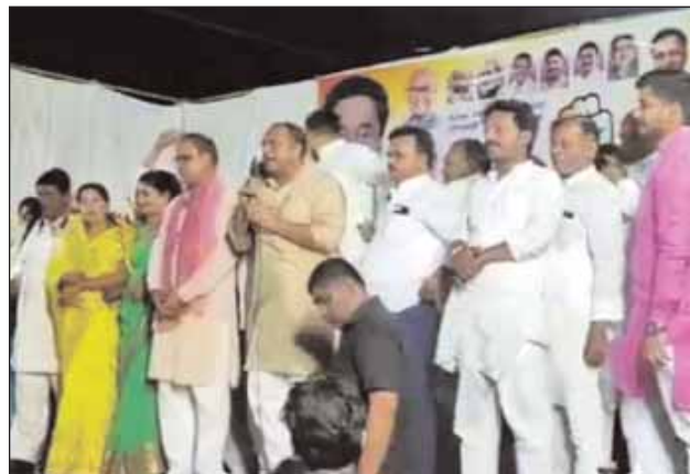
बीना, देशबन्धु। 2018 में प्रदेश में कांग्रेस की सरकार बनी थी लेकिन हमारी सरकार को चोरी कर लिया गया। पहली बार मप्र के इतिहास में ऐसा