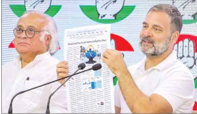
जब अडानी के खिलाफ दस्तावेज हैं, तो मोदी सरकार इस उद्योगपति के खिलाफ कार्रवाई क्यों नहीं करती: राहुल गांधी, कांग्रेस नेता

नई दिल्ली, देशबन्धु। कांग्रेस नेता राहुल गांधी ने उद्योगपति गौतम अडानी पर सीधा हमला करते हुए कहा है कि उन्होंने (श्री अडानी) कोयला घोटाला किया है, जिसके कारण बिजली की कीमतें बढ़ी हैं और बिजली दरें बढ़ाकर जनता के 32000 करोड़ रुपए डकारे गए हैं। श्री गांधी ने बुधवार पार्टी मुख्यालय में आयोजित संवाददाता सम्मेलन में कहा कि पहले हम 20,000 करोड़ के घोटाले की बात कर रहे थे, लेकिन अब एक विदेशी अखबार ने रिपोर्ट छपी है कि 12,000 करोड़ रुपए का और घोटाला हुआ है और इस तरह से अडानी समूह ने पूरे 32,000 करोड़ रुपए का