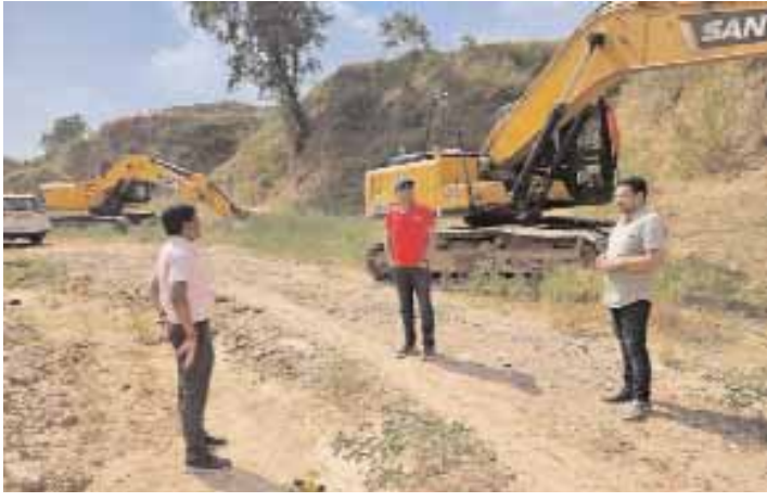
लगातार अवैध रेत उत्खनन वर्षों से चल रहा है तथा करोड़ों के राजस्व का नुकसान प्रशासन

पन्ना, देशबन्धु। जिले की अजयगढ़ तहसील अन्तर्गत विभिन्न स्थानों पर लगातार अवैध रेत उत्खनन मशीनों से चल रहा है। वर्तमान समय में आदर्श आचार संहिता लगाने के बावजूद रेत माफिया पूरी तरह सक्रिय है तथा विभिन्न स्थानों पर मशीनों के माध्यम से रेत उत्खनन कर रहे हैं, जिसमें बीरा, भानपुर, चन्दौर, रामनई, बरोली के संबंध में समाचार पत्रों में अवैध उत्खनन को लेकर समाचार प्रकाशित किये जा रहे हैं। उक्त मामले को कलेक्टर तथा पुलिस अधीक्षक ने संज्ञान में लेते हुए अजयगढ़ क्षेत्र के भ्रमण के दौरान ग्राम बरोली में निजी भूमि पर चल रही रेत की अवैध खदान पर कार्यवाही कराई है। जिसमें दो पोकलैंड मशीनें तथा कुछ ट्रैक्टर जप्त किये गये हैं। ज्ञात हो कि इस क्षेत्र में