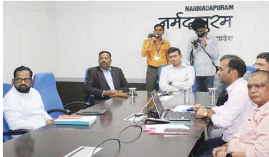
आयोग के निर्देशों के अनुपालन में मतदान प्रक्रिया को पूर्ण रूप से पारदर्शी एवं निष्पक्षता से कराने के लिए रेंडमाइजेशन किया गया है। उन्होंने बताया कि रेंडमाइजेशन की इस प्रक्रिया से मतदान दलों का गठन