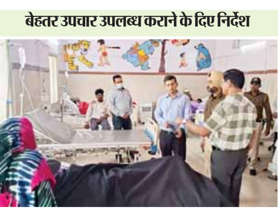
नर्मदापुरम, देशबन्धु। जिले की तहसील माखननगर के ग्राम बुधवाड़ा में शनिवार को हुई सड़क दुर्घटना में घायलों से मिलने कलेक्टर