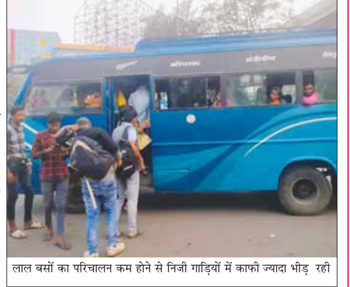
लाल बसों का परिचालन कम होने से निजी गाड़ियों में काफी ज्यादा भीड़ रही

विधानसभा चुनाव में जिले में मतदान प्रक्रिया पूर्ण करने के लिए निर्वाचन आयोग ने मतदान दलों को मतदान केन्द्रों तक लाने के लिए लालपरेड सिटी लिंक लिमिटेड (बीसीएलएल) की करीब 2 सौ लाल बसें का अधिग्रहण किया गया है। इसके चलते जिन मार्गों पर आम दिनों में 15 से 20 बसें दौड़ती हैं, वहां गुरुवार को सिर्फ 5 से 7 बसें ही चलीं। ऐसी ही स्थिति में यात्रियों की परेशानी बढ़ गई। ऐसी स्थिति शुक्रवार को भी रहेगी।