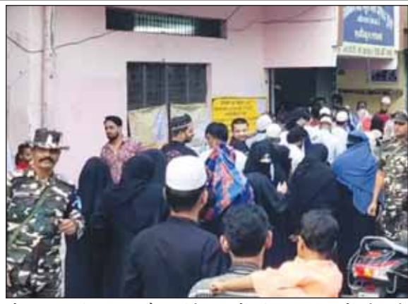
भोपाल मध्य विधानसभा के जहांगीराबाद में महिला मतदाताओं की लगी लंबी कतार रही।