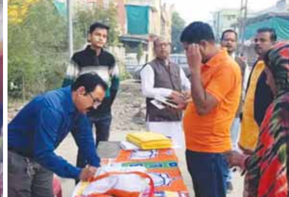
मतदान केंद्र के बाहर राजनीतिक दलों ने मतदाताओं की सुविधा के लिए अपने काउंटर बनाए गए थे।