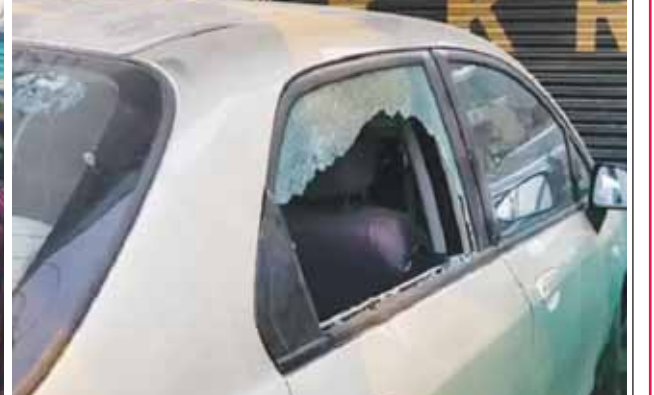
बाग दिलकुशा में अज्ञात युवकों ने मतदान केंद्र के बाहर पथराव कर दिया। इससे पोलिंग एजेंट की गाड़ियों के कांच टूट गए।