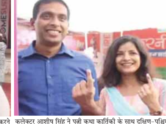
कलेक्टर आशीष सिंह ने पत्नी कथा कार्तिकी के साथ दक्षिण-पश्चिम विधानसभा के चार इमली स्थित मतदान केंद्र पर मतदान किया।