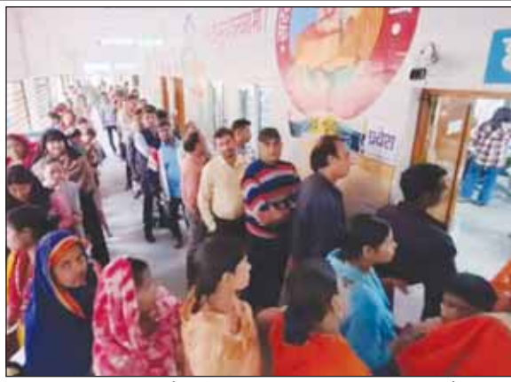
दक्षिण पश्चिम विधानसभा के हर्षवर्धन नगर स्थित सरस्वती शिशु मंदिर के मतदान केंद्र क्रमांक 182 पर मतदाताओं की लंबी कतार लगी नजर आई।

जिले की सभी सात विधानसभा सीटों के लिए कुल 96 उम्मीदवार चुनाव मैदान में हैं। इनमें सबसे ज्यादा 23 उम्मीदवार नरेला विधानसभा सीट से किस्मत आजमा रहे हैं, जबकि सबसे कम 6 उम्मीदवार हुजूर सीट से उतरें हैं। वहीं, 37 निर्दलीय भी उभरे हैं। इस चुनाव में कई दिग्गजों की साख भी दांव पर है।