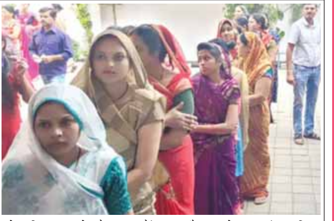
नरेला विधानसभा क्षेत्र के मतदान केंद्र 131 और 136 सेमरा कलां पर महिला मतदाताओं की कतार लगी थी।