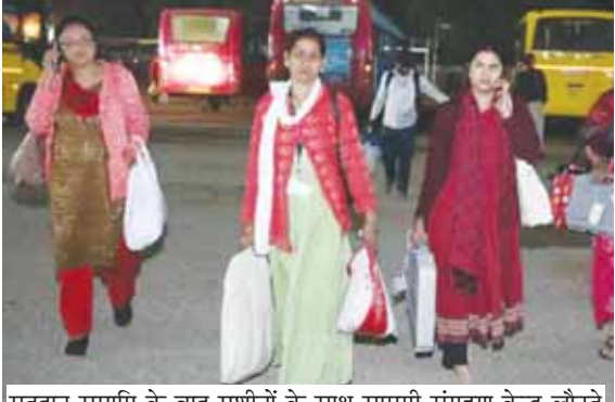
मतदान समाप्ति के बाद मशीनों के साथ सामग्री संग्रहण केन्द्र लौटते हुए मतदान कर्मी

भोपाल, देशाबन्धु। राजधानी के लगभग 21 लाख मतदाताओं ने शुक्रवार को अपनी नई सरकार चुनने के लिए जिले के कुल 2049 मतदान केंद्रों पर सुबह 7 से शाम 6 बजे तक वे मतदान किया गया। जिले की सातों विधानसभा सीट पर 64.72 प्रतिशत मतदान हुआ। हालांकि यह रात 10 बजे तक की स्थिति है। अंतिम अधिकृत आंकड़े जारी होने के बाद मतदान के प्रतिशत में बढ़ोतरी हो सकती है।