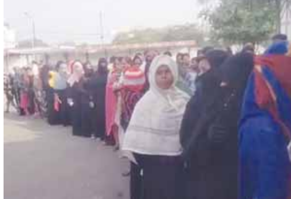
भोपाल उत्तर विधानसभा क्षेत्र के मतदान केंद्र पर महिला मतदाताओं की लंबी-लंबी कतार नजर आई।