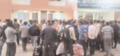
जाने के लिए परेशान हो रहे हैं लेकिन प्रशासन ने कोई व्यवस्था नहीं की है। होमगार्ड जवानों ने बताया कि उन्हें छात्रावास में ठहराया गया है 11 तारीख से यहां रुके हुए हैं, कोई एक अधिकारी ने आकर हमारी सुध नहीं ली है। 18

बैतूल, देशबन्धु। प्रदेश में 17 नवंबर को विधानसभा चुनाव के लिए अन्य राज्यों से आए होमगार्ड के जवान वापसी को लेकर परेशान हो रहे हैं। मतदान समाप्त होते ही सभी होमगार्ड ने अपने-अपने राज्य की ओर लौटने की तैयारी की थी लेकिन ट्रेन लेट होने की वजह से होमगार्ड जवानों को हमलापुर के छात्रावास में समय व्यतीत करना पड़ रहा है। कुछ जवान बुखार से पीड़ित होने के बाद भी प्रशासन ने उनकी सुध नहीं ली। कर्नाटक से लगभग 4000 होमगार्ड के जवान आए थे। जिले के अलग-अलग भागों में ड्यूटी कर रहे थे। चुनाव समाप्त होने के बाद सभी होमगार्ड के जवान अपने-अपने क्षेत्र में वापस