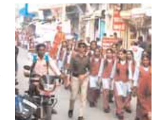
सिरोंज, देशबन्धु। महारानी झलकारी बाई जयंती पर बुधवार को सरस्वती शिशु विद्या मंदिर की छात्राओं ने लैंकरोड स्थित प्रांगण से सुबह मुख्य बाजार के मुख्य मार्गों से भव्य शोभायात्रा निकाली। जिसमें महारानी झलकारी के स्वरूप में बालिकाएं घोड़े पर सवार हुए चल रहीं थीं और छात्राएं जयघोष करती हुयी चल रहीं थीं। शोभायात्रा का समापन वापस स्कूल पहुंचकर हुआ। इस दौरान स्कूल स्टाफ एवं छात्राएं मौजूद रहीं।