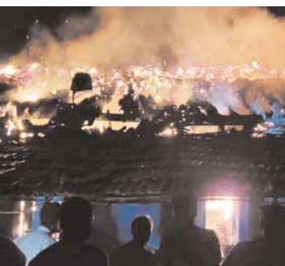
का प्रयास किया, लेकिन आग पर काबू नहीं हो पाया। सूचना मिलने पर नगर पालिका से दो फायर ब्रिगेड