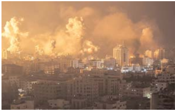
उत्तरी गाजा पर ध्यान केंद्रित कर रहा है, लेकिन पट्टी के सभी हिस्सों पर हमला जारी रखे हैं। सोमवार को इजरायल के प्रधानमंत्री बेंजामिन