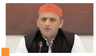
मेरा भी फोन हैक किया गया, जांच कराए सरकार : यादव

लखनऊ, 31 अक्टूबर (देशबन्धु)। समाजवादी पार्टी (सपा) अध्यक्ष अखिलेश यादव ने मंगलवार को कहा कि सरकार को वरिष्ठ नेताओं के मोबाइल फोन हैक और जासूसी के आरोपों की जांच करानी चाहिए और बताया कि ऐसा क्यों किया जा रहा है। पार्टी मुख्यालय में आयोजित एक संवाददाता सम्मेलन में यादव ने कहा कि मुझे एप्पल कंपनी से मैसेज मिला कि आपका फोन हैक किया जा रहा है। यह बहुत अफसोस की बात है कि सत्ता के इशारे पर वरिष्ठ नेताओं के फोन राज्य की एजेंसियां हैक कर रही हैं। उन्होंने कहा कि वे लोकतंत्र में आपकी आजादी और निजता क्यों छीनना चाहते हैं। यह जासूसी क्यों और वह भी इस हद तक कि बड़े नेताओं के फोन सर्विलांस पर लिए जा रहे हैं। लोकतंत्र में ऐसी किसी चीज के लिए कोई जगह नहीं है। सरकार को जांच करानी चाहिए और बताया