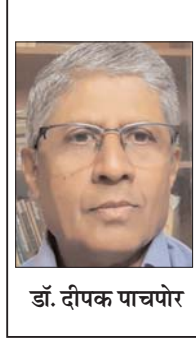
डॉ. दीपक पाचपोर

धुंधाधार प्रचार में जुटेंगे। हालांकि कोई मान नहीं सकता कि जो व्यक्ति चुनाव हो या न हो, हर वक्त एक्शन मोड में दिखता हो और सारे साल जिसकी भाषा और कृत्य ऐसे होते हों मानो वह चुनावी रैली को सम्बोधित कर रहा हो; तो ऐसे मोदी जी कैसे इतने बड़े अवसर व मंच से खुद को विलग कर सकते हैं? अगर यह कोई सोची-समझी योजना है तो देखना होगा कि उस स्थिति में वे कितने प्रभावी होते हैं और भाजपा को उसका कितना लाभ मिलता है। पहले कई चुनावों में देखा गया है कि आचार संहिता लागू होने या चुनाव प्रचार बंद होने के कुछ मिनट पहले तक मोदी चुनावी सभाओं को सम्बोधित करते रहे हैं। हो सकता है कि इसी तर्ज पर वे अंतिम