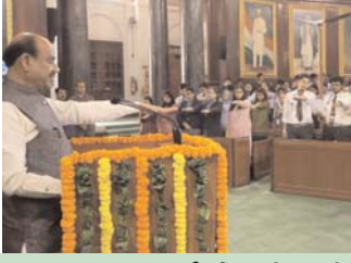
सरदार वल्लभभाई पटेल की जयंती पर की श्रद्धांजलि अर्पित

नई दिल्ली, 31 अक्टूबर (देशबन्धु)। लोकसभा अध्यक्ष ओम बिरला ने मंगलवार को सरदार वल्लभभाई पटेल की जयंती के अवसर पर संविधान सदन के केंद्रीय कक्ष में उनके चित्र पर पुष्पांजलि अर्पित की। इस अवसर पर अपने विचार व्यक्त करते हुए लोकसभा अध्यक्ष ओम बिरला ने आधुनिक भारत को आकार देने में सरदार पटेल के महत्वपूर्ण योगदान का उल्लेख करते हुए कहा कि एक सशक्त संविधान तैयार करने में लौह पुरुष की सराहनीय भूमिका को हमेशा याद किया जाएगा। उन्होंने कहा कि सरदार पटेल के विचार हमारे देश में लोकतंत्र व एकता का आधार हैं। बिरला ने कहा कि हमारे पास एक मजबूत और महत्वपूर्ण संविधान है, जो सरदार पटेल जैसे हमारे नेताओं के अथक प्रयासों का परिणाम है। बिरला ने यह भी कहा कि सरदार पटेल का जीवन हम सभी के लिए एक प्रेरणास्रोत है, जिससे हमें पूरी निष्ठा से देश के कल्याण के लिए समर्पित होने की प्रेरणा मिलती है। बिरला ने कहा कि लोकतांत्रिक मूल्यों का उद्गम स्थल या लोकतंत्र की जन्मनी कहलाने वाले भारत के पास एक महत्वपूर्ण विरासत है। बिरला ने इस बात का