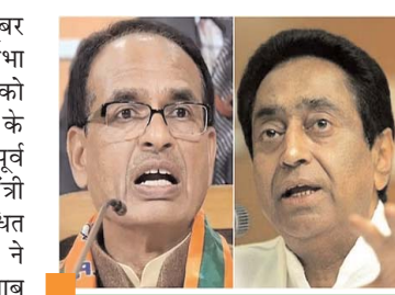
मध्य प्रदेश 18 साल से अत्याचार से त्रस्त है अब अत्याचार के अंत का समय आ गया है : कमलनाथ

भोपाल, 31 अक्टूबर (एजेंसियां)। मध्यप्रदेश विधानसभा चुनाव के पहले राज्य में मंगलवार को शोले फेम जय-वीरू की जोड़ी के सुखियों में बने रहने के बीच पूर्व मुख्यमंत्री कमलनाथ ने मुख्यमंत्री शिवराज सिंह चौहान को संबोधित करते हुए कहा कि जय और वीरू ने ही अत्याचारी गब्बर सिंह का हिसाब किया था। कमलनाथ ने सोशल मीडिया प्लेटफॉर्म एक्स पर पोस्ट किया, शिवराज जी, जय और वीरू ने ही अत्याचारी गब्बर सिंह का हिसाब किया था। मध्य प्रदेश 18 साल से अत्याचार से त्रस्त है। अत्याचार के अंत का समय आ गया है। बाकी आप समझदार हैं। इसके पहले शिवराज चौहान ने बिना किसी का नाम लिए कहा था कि कांग्रेस की जय-वीरू की जोड़ी के बीच लूट के माल के बंटवारे का झगड़ा है। समझा जा रहा है कि उनका ये बयान कमलनाथ और दिग्विजय सिंह के संदर्भ में था। गौरतलब है कि दिग्विजय सिंह और