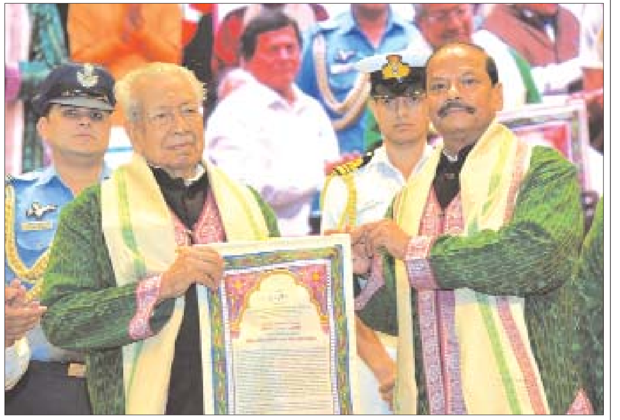
रायपुर, 25 नवंबर। राज्यपाल विश्वभूषण हरिचंदन को भुवनेश्वर के कलिंग इंस्टिट्यूट ऑफ सोशल साइंस ने डी. लिट. की मानद उपाधि प्रदान की है। यह उपाधि उन्हें आज ओड़िशा के राज्यपाल रघुवर दास के हाथों से प्रदान की गई। हरिचंदन को यह सम्मान सामाजिक और सार्वजनिक जीवन में सक्रियता के माध्यम से उल्लेखनीय जन सेवा के लिए दिया गया है। कलिंग इंस्टिट्यूट ऑफ सोशल साइंस के कुलपति प्राध्यापक और गणमान्य अतिथि उक्त अवसर पर आयोजित समारोह में उपस्थित थे।