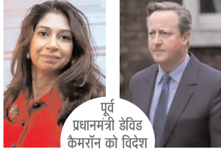
पूर्व प्रधानमंत्री डेविड कैमरॉन को विदेश मंत्री बनाया गया

लंदन, 13 नवम्बर (एजेंसियों)। ब्रिटेन के प्रधानमंत्री रीष सुनक ने सोमवार को मंत्रिमंडल में बड़ा उलटफेर करते हुए एक के बाद एक विवादित बयान देकर सरकार को परेशानी में डालने वाली गृहमंत्री सुएला ब्रेवरमैन को बाहर का रास्ता दिखा दिया। जबकि पूर्व प्रधानमंत्री डेविड कैमरॉन को विदेश मंत्री बनाया गया है। स्कॉटलैंड न्यूज ने अपनी रिपोर्ट में यह जानकारी दी। रिपोर्ट के अनुसार सुश्री ब्रेवरमैन ने पिछले सप्ताह एक अखबार में