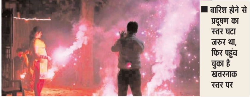
बारिश होने से प्रदूषण का स्तर घटा जरूर था, फिर पहुंच चुका है खतरनाक स्तर पर

भारत में रियल टाइम एक्यूआई की जानकारी देने वाली वेबसाइट के अनुसार भारत में दिवाली के बाद सबसे ज्यादा प्रदूषित शहरों में दिल्ली का नाम तो है, मगर यह दूसरे नंबर पर है। पहले नंबर पर बिहार की राजधानी पटना का नंबर है, जहां सुबह औसत एक्यूआई 572 दर्ज किया गया। वहीं, दूसरे नंबर पर दिल्ली का एक्यूआर 468 रहा। दिल्ली के पड़ोस में स्थित यूपी के नोएडा का एक्यूआई-410 यानी बेहद खतरनाक श्रेणी में दर्ज किया गया।