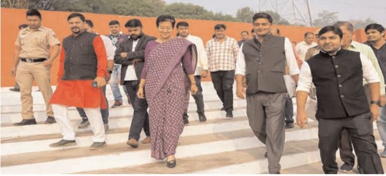
प्रकाश, स्वच्छता, सुरक्षा आदि सभी चीजें मुहैया कराने तक सारा इंतजाम कर रही है।

नई दिल्ली, 17 नवम्बर (देशबन्धु)। दिल्ली की राज्य मंत्री आतिथी ने शुक्रवार को आईटीओ और पश्चिम विनोद नगर में छठ की तैयारियों में कोई कमी नहीं रहने दी जाएगी। उन्होंने कहा कि दिल्ली में छठ की तैयारियों का जायजा लिया। उन्होंने इस बात पर जोर दिया कि सरकार तैयारियों में कोई कमी नहीं रहने देगी। उन्होंने कहा कि दिल्ली में बड़ी संख्या में पूर्वांचल के लोग रहते हैं जो दिल्ली के विकास में सामाजिक, आर्थिक एवं सांस्कृतिक रूप से योगदान देते हैं। आतिथी ने कहा कि छठ उन सभी के लिए एक महत्वपूर्ण पर्व है। इस सिलसिले में पिछले आठ वर्षों से अरविंद केजरीवाल सरकार पूरी दिल्ली में भव्य तरीके से छठ महापर्व का आयोजन कर रही है। उन्होंने कहा कि दिल्ली में छठ की तैयारियों में कोई कमी नहीं रहने दी जाएगी। उन्होंने कहा कि मुख्यमंत्री केजरीवाल के निर्देश पर सभी विधायक और विभाग के लोग ग्रांड जैरो पर हैं। उन्होंने कहा कि सरकार ने श्रद्धालुओं के लिए 1,000 से ज्यादा घाट बनाए हैं ताकि लोग अपने घरों के आसपास ही यह पर्व मना सकें। मंत्री ने कहा कि दिल्ली सरकार इन घाटों पर तालाब निर्माण से लेकर टेंट,