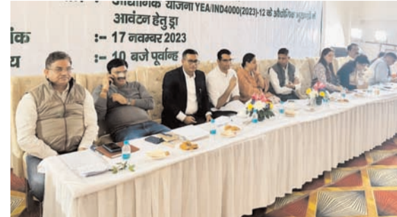
आवंटन कर दिया गया। सेक्टर पी-3 के सामुदायिक केंद्र में झा

पांच हजार से अधिक युवाओं को रोजगार मिलेगा। यमुना प्राधिकरण ने 4000 वर्ग मीटर से छोटे भूखंड के लिए योजना निकाली थी। इस योजना में 109 भूखंड शामिल किए गए थे। इस योजना में 300 वर्ग मीटर, 450, 595, 1800, 2000, 3000 और 4000 वर्ग मीटर के भूखंड थे हैं। 3095 आवंटकों के बीच 16 हजार करोड़ का निवेश हो सकेगा। इन उद्योगों के लगने से