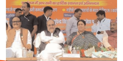
गढ़ व छत्तीसगढ़ में भाजपा के जीतने का किया दावा

दरवाजे बंद कर लेते हैं। लेकिन राजेश मसाला गरीबों के लिए दिल का दरवाजा खुला रखा है। अमेठी के आठ हजार गरीबों