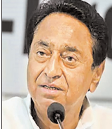
■ गवतों की संख्या व दान की तीन गुना रपतार

उन्होंने कहा कि कांग्रेस की सरकार आने पर नौजवानों को रोजगार, 100 यूनिट बिजली मुफ्त, किसानों को पांच हारस पावर बिजली फ्री देने का काम करेंगे। मंदसौर में किसान आंदोलन के समय पर हुए मुकदमे वापस लेने का काम कांग्रेस सरकार करेगी। उन्होंने कहा कि भाजपा सरकार ने सत्ते पर भी कर लगाया हुआ है। इतना कर लेने के बाद का भी प्रदेश की अर्थव्यवस्था चौपट है। उन्होंने भाजपा