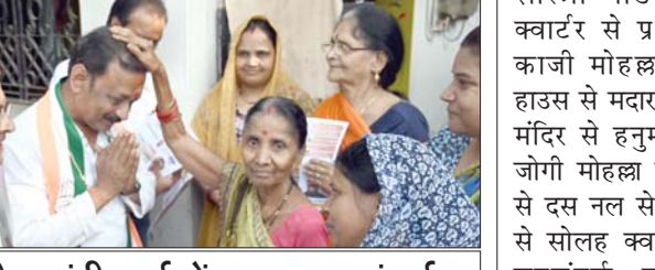
राजीव गांधी वार्ड में सघन जनसंपर्क

26 तक, अंबेडकर कॉलोनी, समता कॉलोनी, जीटी परिसर, कृष्णा कॉलोनी, आदि इलाकों में सघन जनसंपर्क किया।