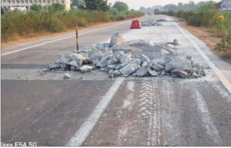
law F54 5G

गांधीग्राम, देशबन्धु। राष्ट्रीय राजमार्ग क्रमांक 30 जबलपुर कटनी हाईवे फोरलेन सड़क मार्ग पर ग्राम गांधीग्राम, रामपुर, कुशनेर, मोहतरा के पास स्थित बधेला नाला पुल, घाट सिमरिया, सीमेंट कंक्रीट सड़क मार्ग पर सड़क बनने के कुछ महीने बाद क्रेक आ गए थे जिन क्रेकों को भरने के लिए केमिकल वा डामर युक्त रेत से भरने का अनेकों बार प्रयास किया गया किंतु वाहनों के अत्यधिक दबाव के कारण यह सड़क मार्ग का हिस्सा कई स्थानों पर अधिक धँस गया था। साथ ही दरारें भी अपेक्षाकृत अधिक चौड़ी हो गई हैं।