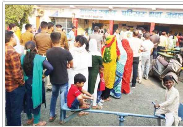
जबलपुर, देशबन्धु। कौन हारा-कौन जीता पलड़ा किसका भारी ये बचपन क्या जाने।