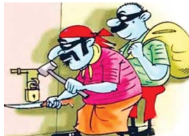
394/23 धारा 457, 380 भादवि का अपराध पंजीबद्ध कर विवेचना में लिया गया।

सामान बिखरा पड़ा था पत्नी के द्वारा चैक करने पर पाया कि सोने की एक जोड़ी झुमकी, 2 अंगूठी, कान की लड़, मंगलसूत्र एक जोड़ी, झुमकी, चांदी की पायल 5 जोड़ी, बच्चे की 2 जोड़ी पायल, चांदी के कड़े एक जोड़ी, चांदी की पायल 4 नग, 25 हजार रुपये गायब थे कोई अज्ञात चोर दरवाजे को तोड़कर घर में घुसकर आलमारियों के लांकर तोड़कर सोने चांदी के जेवर एवं नगदी चोरी कर लिया है। लिखित शिकायत पर अपराध क्रमांक