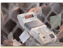
मतगणना के लिए लगेगी 14 टेबल

की तैनाती में जुटी है। 17 नवम्बर को हुए मतदान के बाद अब तीन दिसम्बर को मतगणना होगी। मतगणना को लेकर प्रदेश के दोनों ही प्रमुख दल भाजपा-कांग्रेस सहित सपा, बसपा, आप और अन्य दलों द्वारा मतगणना की प्लानिंग बनाई जा रही है। मतों की गणना को लेकर भाजपा ने गत दिनों भाजपा मुख्यालय भोपाल में विशेष बैठक आयोजित की। इस बैठक में मुख्यमंत्री