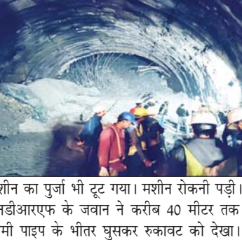
मशीन का पुर्जा भी टूट गया। मशीन रोकनी पड़ी। इसके बाद एनडीआरएफ के जवान ने करीब 40 मीटर तक पहुंचे 800 मिमी पाइप के भीतर घुसकर रुकावट को देखा। उन्होंने इसे

उत्तरकाशी, देशबन्धु। सिलक्यारा सुरंग के भीतर फसे 41 मजदूरों को बाहर निकालने का उत्साह बृहस्पतिवार को दिनभर उतार चढ़ाव लेता रहा। अडचनों की वजह से मजदूरों के बाहर आने का इंतजार बढ़ता रहा। सड़क परिवहन और राजमार्ग मंत्रालय में राज्य मंत्री जनरल वीके सिंह मुख्यमंत्री पुष्कर सिंह धामी भी देर शाम तक ऑपरेशन सिलक्यारा के सफल होने का इंतजार कर रहे थे। बुधवार की रात को चले अभियान की रफ्तार से ये उम्मीद जताई जा रही थी कि बृहस्पतिवार की सुबह तक सभी 41 मजदूर सकुशल बाहर आ जाएंगे, लेकिन रात को अमेरिकन ऑगर ड्रिल मशीन की राह में लोहे के सरिफ व गाटर आ गए जो टनल के भीतर के स्ट्रक्चर के लिए लगाए गए थे। इससे