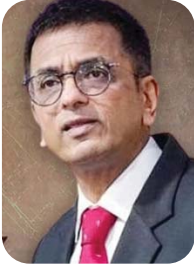
सुप्रीम कोर्ट ने 'लोगों की अदालत' के तौर पर काम किया

नई दिल्ली, (एजेंसियां)। सुप्रीम कोर्ट के चीफ जस्टिस डीवाई चंद्रचूड़ ने रविवार को संविधान दिवस के मौके पर कहा कि सुप्रीम कोर्ट ने अब तक 'लोगों की अदालत' के तौर पर काम किया है और नागरिकों को न तो कोर्ट आने से डरना चाहिए और न ही उन्हें इसे अंतिम उपाय के तौर पर देखना चाहिए। सुप्रीम कोर्ट में संविधान दिवस से जुड़े कार्यक्रम की शुरुआत करते हुए सीजेआई चंद्रचूड़ ने कहा कि जिस तरह संविधान लोकतांत्रिक संस्थाओं और प्रक्रियाओं के जरिए हमें राजनीतिक मतभेदों को खत्म करने में मदद करता है। उसी तरह कोर्ट की प्रणाली हमें स्थापित सिद्धांतों और प्रक्रियाओं के जरिए कई तरह की असहमतियों को सुलझाने में मदद करती है। इसलिए हम कह सकते हैं कि कोर्ट में हर केस संवैधानिक शासन का विस्तार है। इस कार्यक्रम की शुरुआत राष्ट्रपति द्रौपदी मुर्मू के भाषण से हुई। कार्यक्रम में सुप्रीम कोर्ट के जज जस्टिस संजीव किशन कौल, जस्टिस संजीव खन्ना मौजूद रहे। इसके अलावा कानून मंत्री अजुन राम मेघवाल भी उपस्थित रहे।