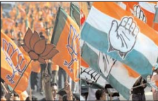
■ पिछले चुनाव में कांग्रेस ने बदले सतीकरण

ढूंढाड़ में जातिगत समीकरण भी बहुत ज्यादा प्रभाव रखते हैं। यहां का शहरी इलाका भाजपा का गढ़ रहा है। खास तौर पर जयपुर में आने वाली सीटों पर भाजपा की अच्छी पकड़ बनाई है। हालांकि, पिछले चुनाव में यहां कांग्रेस मजबूत रही। ढूंढाड़ में सामान्य वर्ग के बनिया, राजपूत और ब्राह्मण हमेशा भाजपा के साथ रहे हैं। लेकिन, यहां की कई सीटों पर एससी/एसटी का भी दबदबा है। एसटी वर्ग के बड़े क्षत्रप किरोड़ी लाल मीणा, नमो नारायण मीना, जसकौर मीना जैसे नेता इसी क्षेत्र ने दिए हैं। इस क्षेत्र की कई सीटों पर