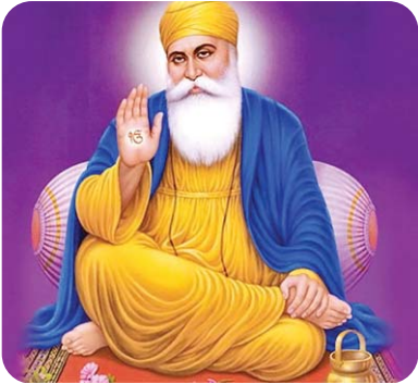
नानक नाम चढ़दी कलां-तेरे

कूपे में सामने वाली बर्थ पर एक छोटा सा सिख परिवार बैठा था – माँ, उनका नौजवान बेटा और एक किशोरवय बेटा। उनके पिता और चाचा पकिस्तान से लरकाना साहिब में मत्था टेक कर 3 दिन बाद आने वाले थे और वे उन्हें लिवाने के लिये अमृतसर जा रहे थे। जैसा कि अमूमन ट्रेन यात्राओं में होता है परिचय की शुरुआत आप कहाँ जा रहे हैं से हुई। जैसे ही उन्हें पता चला की हम मुस्लिम हैं और हरमिंदर साहिब दर्शन के लिए जा रहे हैं वो इतने प्रसन्न और अभिभूत हुए की उसको बर्‍या करना मुश्किल है। पंजाबी अपने खाने/खिलाने के शौक के लिए पूरी दुनिया में मशहूर हैं आप यकीन नहीं करेंगे दोस्तों अमृतसर तक लगभग 35 घंटों के सफर में उन्होंने हमें 35 रूपये भी खर्च नहीं करने दिए। इतना सारा और इतनी तरह का खाना ले कर वो चले थे कि पूरे सफर के दौरान हम अपना टिफ़िन निकाल ही नहीं पाए। यही नहीं अपने परिजनों के लिए स्वर्णमंदिर परिसर के बाहर ट्रस्ट की धर्मशाला में आरक्षित एसी कक्ष 24 घंटे के लिए हमें उपलब्ध करा दिया, अपने साथ हरमिंदर साहिब के दर्शन करायें और बाधा सरहद तक लेकर गये।