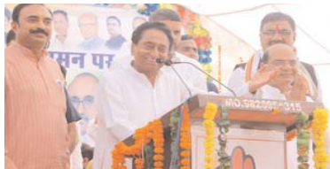
करीब इस वर्ग के उम्मीदवारों को मैदान में उतारा है। तो, वहीं ऐसे नेताओं को भी सक्रिय किया है, जिनको इस वर्ग में पकड़ है। राज्य की सियासत में ओबीसी वर्ग का खासा प्रभाव है और वह चुनाव में निर्णायक स्थिति में भी है।

राज्य में 230 विधानसभा सीटों पर चुनाव हो रहे हैं और सरकार बनाने के लिए 116 स्थान पर जीत जरूरी है। कांग्रेस बहुमत हासिल करने के लिए सबसे बड़े खड़े नेताओं ओबीसी को लुभाने में किसी तरह की कसर नहीं छोड़ रही है। यहाँ कारण है कि कांग्रेस ने लगभग 27 प्रतिशत यानी कि 60 के