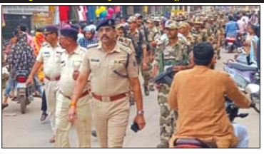
के गुंडेबदमाशां, चाकूबाजी करने वाले पर सख्त कार्रवाई करने के लिये फ्लैग मार्च के माध्यम से अपराधियों