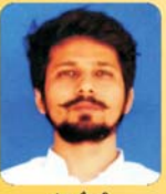
वंश चौधरी अग्रव राईस इंडस्ट्रीज कुराभी