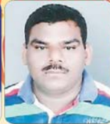
संजु पटेल मंथन राईस मिल विगवाडी