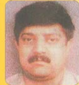
दीनदयाल अग्रवाल रामजी राईस मिल विगवाडी