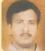
संतोष केडिया रामजी इटर्स अमेर