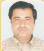
मोपाल केडिया संजल फूड्स अम्बडीह