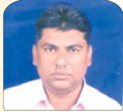
एम कलाम (मुन्ना भाई) बालोद