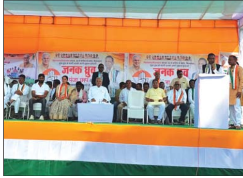
रायपुर, 11 नवंबर (देशबन्धु)। विधानसभा आम चुनाव के समय के दौरान रायपुर के एक स्थान पर एक महिला समूह का एक तस्वीर।