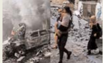
इजरायली बमबारी में 26 नागरिकों की मौत

गजा। दक्षिण गाजा में खान युसिफ शहर पर शनिवार तड़के इजरायली बमबारी में लगभग 26 फिलिस्तीनी नागरिक मारे गए। फिलिस्तीनी समाचार एजेंसी वाकान ने यह जानकारी दी है। स्थानीय सूत्रों का खवाल देते हुए रिपोर्टों में कहा गया है कि इजरायली विमानों ने खान युसिफ के अस्पतालों पर कई हमले किए, जिससे 26 नागरिकों की मौत हो गई, मुर्कों से ज्यादातर बच्चे थे। हमले में कई लोग घायल हो गए हैं। इजरायली सेना ने रिपोर्टों पर तुरंत कोई टिप्पणी नहीं की।