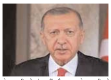
तुर्की ने बंधकों को अदला-बदली की वकालत की

अंकारा, 18 नवम्बर (ए.पी.सी.)। तुर्की गणराज्य में अफगानिस्तान को अन्दर, कबुली को बहाल करता है, अफगानिस्तान पर है कि इजरायल ने फिलिस्तीनी अधीनस्थ हमला की तुलना में कई गुना अधिक लोगों को बंधक बना रहा है। तुर्की के राष्ट्रपति रेसेप तैय्यप एर्दोगन ने शुक्रवार को बंधकों को अदला-बदली पर एक संयुक्त संघबन्धन सम्मेलन में कहा, हा, हम भी अधिक बंधकालत करने हैं, अगर बंधकों को संस्था को खाना कर दो इजवतिये।