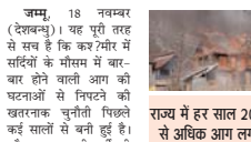
कश्मीर में सर्दियों में आग की घटनाओं से निपटना एक चुनौती

जम्मू, 18 नवम्बर (दैनिकभू)। 7 नवरी राह से सके है कि चरम शीत में सर्दियों के मौसम में बा-बाद होने वाली आग की घटनाओं से निपटने की चुनौतिका चुनौती पिछले कई सालों से बनी हुई है। और इस साल भी चरम की शुरुआत के साथ ही अतिगर्मान और आसिफतात्मक सेवा विभाग ने अपने कर्मियों और स्थानीय को तैयार कर लिया है और राशानीय शहर में आग की घटनाओं से निपटने में आसिफ में किसी भी आसिफतात्मक स्थिति से निपटने के लिए 70 से अधिक फायर टेंडरों को अतिरिक्त रखे हैं। जानकारी के लिए आमदौर पर,