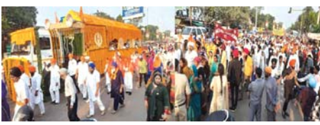
सिक्ख समाज द्वारा आज प्रथम गुरु नानक जयंती के प्रकाश वर्ष पर भव्य वृक्ष विहाल नगर कीर्तन निकाला गया।

सिक्ख समाज द्वारा आज प्रथम गुरु नानक जयंती के प्रकाश वर्ष पर भव्य वृक्ष विहाल नगर कीर्तन निकाला गया। नगर कीर्तन में बड़ी संख्या में सहिष्णु भी शामिल हुईं। नगर कीर्तन के मध्य में सिक्ख युवाओं ने तरह तरह के अखाड़ा व बदन को प्रदर्शन किया। सिक्ख गुरुद्वारा से निकले नगर कीर्तन ने नगर प्रथम क्रम गुरु नानक जयंती के प्रकाश वर्ष पर भव्य वृक्ष विहाल नगर कीर्तन निकाला गया।