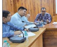
कर्मचारी, 21 नवंबर (देशभूषण) । मगरा निवासी अयोग्य एवं मूढ़ निवासी प्रदायिकाजी चुरीसाइद द्वारा समरा सहायिका अरुणा अरुणा 03 दिरसंबर को विधारणा निवासी को मतगणना गे। करीबगणना क्षेत्र के विधारणा क्षेत्र परंपरिय कर्मचारों में प्राप्ता मती को गणना के लिए कर्मचारी के थ्यानो निरवना कृष्ण चौरि परिसर को मतगणना स्थल बनाया गया है, जहाँ दोनो विधारणा मंत्र प्रभारी मती को गणना होगा।

कलेक्टर एवं जिला निवासी अधिकारी श्री नमनजय महोले ने आभार निवासी अयोग्य के दिराना निवासी अरुणा विधारणा 71-पंडरिया और विधारणा 72-कर्मचारी के मतगणना की तैयारी में डेकल टो 1 डेकल में विधारणा आम निर्वाचन 2023 के मतगणना कार्य के सुचारु संचालन के लिए निर्वाचन अधिकारियों को अज्ञात-अज्ञात धारिण सँसित 1 डेकल के वडा कलेक्टर सहित अधिकारियों ने मतगणना स्थल का निरीक्षण भी किया। कलेक्टर एवं जिला निवासी अधिकारी ने कहा कि