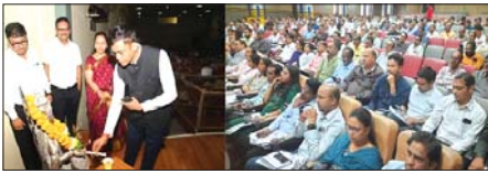
दुर्ग, बेमेटरा एवं बालोद के अधिकारियों का बैठक सत्र।

दुर्ग, बेमेटरा एवं बालोद के अधिकारी हुए सम्मिलित, मतगणना स्थल पर मोबाईल प्रतिबंधित