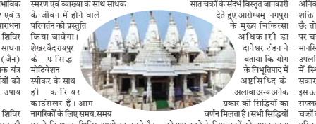
पाश्र्व तीर्थ नगपुरा में दो दिवसीय निःशुल्क चक्र साधना शिविर 2 दिसंबर से