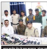
थाना बालोदर क्षेत्र के ग्राम झरमाला, संयंत्र ग्राम, ग्राम कोराछूड़ इन्हें केन्द्र में हुए चोरी के कुल 3 प्रकरणों में लताका के सोने, चांदी के जेवरों सहित 142000 रुपय में हुए अपराधी साजित 7