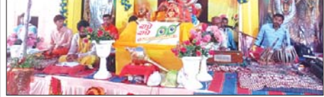
हरनाकांथा में भागवत कथा संरंभ