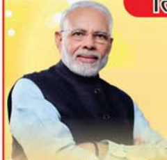
मा. नरेन्द्र मोदी प्रधानमंत्री