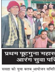
प्रथम फूटगुना महासमुंद एवं द्वितीय स्थान आरंग सुवा परिवार ने प्राप्त किया।

बलीदाबाजार, 23 नवंबर (देशव्यू)। ग्राम मोहतरा (बलीदाबाजार) में युवा क्लब मोहतरा द्वारा युवा नृत्य प्रतियोगिता 2023 आयोजित की गई।