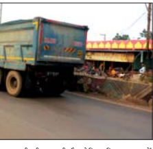
ड्रायवर्टर जॉब पडलल से बचने के लिए रेत और गिट्टी का परिवहन रोज के समय हो रहा है। डेढ़ से 2 फिट ज़ाला ऊंचा कर लाते हैं ओवरलोड सामान

बेमेतरा, 27 नवम्बर (देशबन्धु)। बिना रायल्टी पर्ची के रेत गिट्टी का ओवरलोड वाहनों से परिवहन हो रहा है। जिसके तरफ़ जिला स्टह के अधिकाधिकारी को लक्ष्मणबादी एवं उदयगंगा के चलाते सेवा कार्यालयों वालों चाहिए वह नहीं हो पा रहा है जिसके कारण अबैध रूप से वाहनों के माध्यम से रेत गिट्टी ले जाने वाले जाने वालों के हीरोला इन दिनों बुरी तरह है।