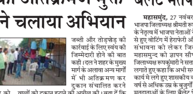
पालिका को दुवनान हटाने की अपील की। बताने कि शहर के मुख्य मार्ग में सरकत के दोनो किनारों पर नदुवन संघालित करने को बनेके ये यातायात फिकार प्रभाविती होती है जिससे गांवों में यातायात व्यवस्था सुगम हो सके और मार्ग में होने वाले बाहकता पर लगाम सार >>> शेष पृष्ठ 9 पार

महासमुद्र, 27 नवंबर (देशबन्धु) । पालिका ने शहर के मुख्य मार्ग के अलावा अन्य मार्गों में अतिक्रमण व्यवस्था को दुरुस्त करके अतिक्रमण मुक्त करने अभियान को शुरुआत की है। रिविचार को पालिका के अतिक्रमण मुक्त शहर के मुख्य मार्ग में कूल्लु धोती उमान से लेकर बहुरी ठापी तक सरकत दोनो ओर अतिक्रमण कर नदुवन संघालित करके बावो को हटाने के साथ धरियान में सरकत फिकारे दुवन संघालित नहीं करने की मसुदाशाह हुल भक्ताय में पालिका द्वारा फिका जाने वाली