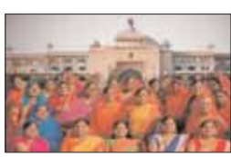
81 विस क्षेत्रों में एक भी महिला प्रत्याशी नहीं

चुनावों के एलान से पहले देश में महिला आरक्षण को संसद में विधेयक का क्रेडिट लेने को लेकर बीजेपी और कांग्रेस में जबरदस्त तकरार देखने को मिली। प्रधानमंत्री नरेंद्र मोदी से लेकर यूपीए चेयरपर्सन सोनिया गांधी तक ने भाषण देकर बताया कि महिलाओं को आगे बढ़ाने के लिए उनकी पार्टी की क्या सोच है, लेकिन विधानसभा चुनावों का एलान होते ही सियासी दावों और वादों की पोल खुल गई।