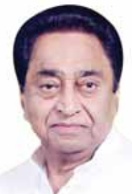
मध्य प्रदेश विधानसभा चुनाव के नतीजे आ चुके हैं। 230 सदस्यीय विधानसभा में भाजपा को सबसे ज्यादा 163 सीटें मिलीं हैं। इसके साथ राज्य में भाजपा सरकार बनना तय हो गया है। वहीं, कांग्रेस के खाते में 66 सीटें गई हैं। एक सीट भारत आदिवासी पार्टी के खाते में गई है। चुनाव जीतने वाले सभी 230 उम्मीदवारों के हस्तप्रनाम का विश्लेषण एसोसिएशन फॉर डेमोक्रेटिक रिफॉर्म (एडीआर) ने किया है। एडीआर के मुताबिक 230 में से 90 (39 फीसदी) नव निर्वाचित विधायकों ने अपने ऊपर आपराधिक मामले दर्ज होने की जानकारी दी है। 2018 के मुकाबले दागी उम्मीदवारों की संख्या में कमी आई है। 2018 में जीते उम्मीदवारों में से 94 पर आपराधिक मामले दर्ज थे। गंभीर धाराओं में मामले दर्ज होने की बात करें तो 90 में से 34 नवनिर्वाचित विधायकों पर गंभीर धाराओं में मुकदमे चल रहे हैं। 2018 के विजेताओं में इस तरह के 47 उम्मीदवार थे। नई विधानसभा के 89 फीसदी (कुल 205) सदस्य करोड़पति होंगे। प्रत्येक विजेता उम्मीदवार की औसत संपत्ति 11.77 करोड़ रुपये है। करोड़पति विजेताओं की संख्या में इजाफा हुआ है। 2018 में जीते 90 में से 68 (76 फीसदी) उम्मीदवार करोड़पति थे। जो अब बढ़कर 72 (80 फीसदी) हो गए हैं। करोड़पति उम्मीदवारों के जीतने का प्रतिशत 2018 के मुकाबले बढ़ा है। 2018 में 81 फीसदी विजेता करोड़पति थे, जो अब बढ़कर 89 फीसदी हो गए हैं।

भोपाल, देशबन्धु। नई विधानसभा के 89 फीसदी (कुल 205) सदस्य करोड़पति होंगे। प्रत्येक विजेता उम्मीदवार की औसत संपत्ति 11.77 करोड़ रुपये है। करोड़पति विजेताओं की संख्या में इजाफा हुआ है। 2018 में जीते 90 में से 68 (76 फीसदी) उम्मीदवार करोड़पति थे। जो अब बढ़कर 72 (80 फीसदी) हो गए हैं। करोड़पति उम्मीदवारों के जीतने का प्रतिशत 2018 के मुकाबले बढ़ा है। 2018 में 81 फीसदी विजेता करोड़पति थे, जो अब बढ़कर 89 फीसदी हो गए हैं।