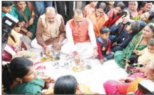
भोपाल, देशबन्धु। मुख्यमंत्री शिवराज सिंह चौहान को आज नया बसेरा कोटरा भोपाल में लाइली बहनों ने भोजन कराया। मुख्यमंत्री चौहान के कोटरा स्थित नया बसेरा में पहुंचने पर लाइली बहनों ने स्वागत भी किया। मुख्यमंत्री श्री चौहान ने बहनों के बीच बैठकर सख्त भोजन किया। उन्होंने लाइली बहनों और उपस्थित जन-समुदाय से भेंट की। उन्होंने विभिन्न समस्याओं को हल करने का आश्वासन भी दिया।

मुख्यमंत्री शिवराज सिंह चौहान को आज नया बसेरा कोटरा भोपाल में लाइली बहनों ने भोजन कराया। मुख्यमंत्री चौहान के कोटरा स्थित नया बसेरा में पहुंचने पर लाइली बहनों ने स्वागत भी किया। मुख्यमंत्री श्री चौहान ने बहनों के बीच बैठकर सख्त भोजन किया। उन्होंने लाइली बहनों और उपस्थित जन-समुदाय से भेंट की। उन्होंने विभिन्न समस्याओं को हल करने का आश्वासन भी दिया।