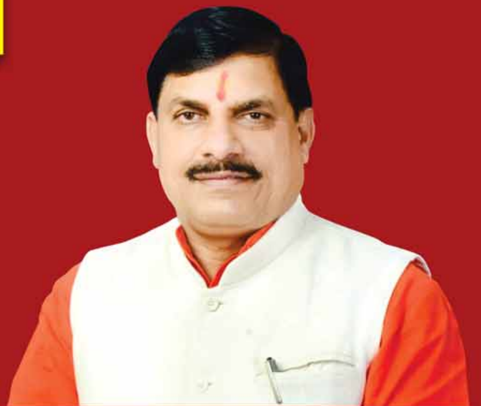
डॉ. मोहन यादव नवनिर्वाचित मुख्यमंत्री