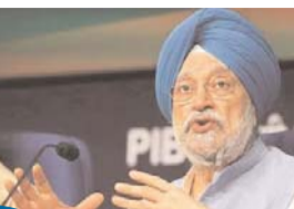
भारत शोक में कुवैत के नेतृत्व व लोगों के साथ एकजुट

नई दिल्ली, 17 दिसम्बर (एजेंसियां)। विदेश मंत्रालय (एमईए) ने रिवार को कहा कि पेट्रोलियम और प्राकृतिक गैस और आवास व शहरी मामलों के मंत्री हरदीप सिंह पुरी भारत सरकार और लोगों की ओर से कुवैत राज्य के अमीर शेख नवाफ अल-अहमद अल-जबर अल-सबा के प्रति संवेदना जताने के लिए 17 दिसंबर को प्रधानमंत्री नरेंद्र मोदी के विशेष दूत के रूप में कुवैत का दौरा करेंगे। विदेश मंत्रालय ने कहा कि भारत सरकार और भारत के लोग 16 दिसंबर 2023 को कुवैत राज्य के अमीर महाहिम शेख नवाफ अल-अहमद अल-जबर अल-सबा के निधन पर गहरी संवेदना व्यक्त करते हैं। इसमें कहा गया, भारत सरकार ने दिवंगत नेता के सम्मान में 17 दिसंबर को पूरे देश में राजकीय शोक की घोषणा की है। विदेश मंत्रालय ने कहा, पुरी सरकार और भारत के लोगों की ओर से संवेदना व्यक्त करने के लिए 17 दिसंबर को प्रधान मंत्री के विशेष दूत के रूप में कुवैत का