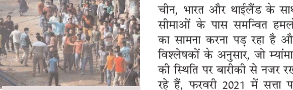
बांग्लादेश में 7 जनवरी को होने है चुनाव

दुका, 17 दिसम्बर (एजेंसियां)। सेना शासित म्यांमार में गृह युद्ध के बीच, हिंसक आंदोलन ने एक और पड़ोसी देश बांग्लादेश को अपनी चपेट में ले लिया है, जहां चुनाव आयोजन द्वारा 15 नवंबर को संसदीय चुनाव कार्यक्रम की घोषणा के बाद से देशव्यापी हलचल जारी है। 35 सीटों वाली (5 सीटें विशेष रूप से महिलाओं के लिए आरक्षित) बांग्लादेश संसद का जिस %जातीय संसद% के नाम से जाना जाता है, के लिए चुनाव 7 जनवरी को होंगे।