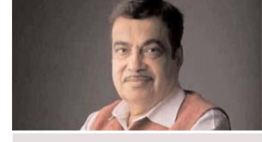
20 दिसम्बर तक तक चलेगा कॉन्फ्लेव