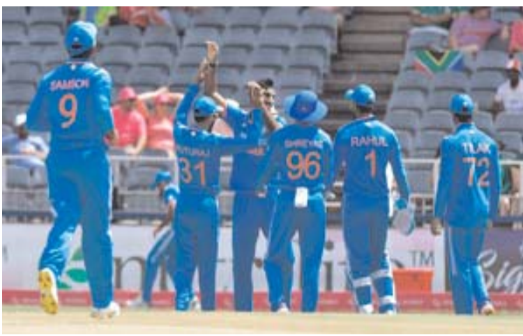
साधारण से स्कोर पर ऑलआउट हो गई। बेहतरीन पारियों ने दक्षिण अफ्रीकी गेंदबाजों को वापसी करने का कोई मौका नहीं दिया।

जोहान्सबर्ग, 17 दिसंबर (एजेंसियां)। भारत और दक्षिण अफ्रीका के बीच रविवार को खेले गए वनडे सीरीज के पहले मुकाबले में टीम इंडिया ने एकतरफा जीत दर्ज की। 116 रनों पर मेजबान टीम को ढेर करने के बाद भारत ने दो विकेट के नुकसान पर 117 रन बनाकर 16.4 ओवर में इस लक्ष्य का सफलतापूर्वक पीछा किया। भारत ने 200 गेंद शेष रहते आठ विकेट से मुकाबला अपने नाम किया और तीन मैचों की सीरीज में 1-0 की बढ़त बना ली।