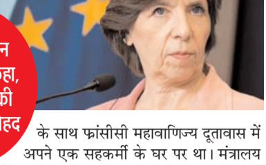
विदेश मंत्री कैथरीन कोलोना ने कहा, पेरिस क्षेत्र की स्थिति पर 'बेहद चिंतित'

आवासीय इमारत पर हुये हमले की निंदा करता है जिसमें कई अन्य नागरिक मारे गए। मंत्रालय ने कहा, हम इजरायली अधिकारियों से इस बमबारी की परिस्थितियों पर शीघ्र अति शीघ्र स्पष्टीकरण चाहते हैं इससे पहले प्रधानमंत्री बेर्नार्दिन नेत्याहू को शनिवार को बंधकों के रिश्तेदारों के विरोध का सामना करना पड़ा, जिन्होंने सेना द्वारा गाजा में तीन बंदियों को गलती से मारने की बात स्वीकार करने के बाद उनकी स्वतंत्रता को सुरक्षित करने के लिए तत्काल समझौते की मांग की। उन्होंने अपने तीन बंधकों की मौत के बारे में संवाददाताओं से कहा, गहरे दुख के साथ मैं स्पष्ट करना चाहता हूँ कि अपहृत की वापसी और हमारे दुश्मनों पर जीत हासिल करने के लिए सैन्य दबाव आवश्यक है। दूसरी तरफ हमारे ने टेलीग्राम पर कहा, जब तक हमारे लोगों के खिलाफ आक्रामकता पूरी तरह से बंद नहीं हो जाती तब तक हम कैदियों की अदला-बदली के लिए किसी भी बातचीत के खिलाफ है।