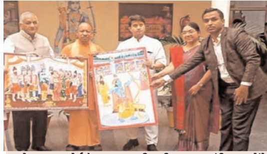
अयोध्या एअरपोर्ट के उद्घाटन की तारीख प्रधानमंत्री तय करेंगे