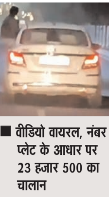
वीडियो वायरल, नंबर प्लेट के आधार पर 23 हजार 500 का चालान

नोएडा, 2 दिसम्बर (देशबन्धु)। सोशल मीडिया पर एक वीडियो शनिवार को वायरल हो रहा है। इस वीडियो में एक युवती कार की खिड़की से बाहर निकलकर स्टंट कर रही है। पीछे से आ रहे किसी व्यक्ति ने इसकी वीडियो बनाया और सोशल मीडिया पर पोस्ट कर दिया। तब से लोग ट्विटर करके सख्त कार्रवाई की मांग कर रहे हैं। ये वीडियो 29 सेकंड का है और प्रेनो वेस्ट के एक मूर्ति के पास का बताया जा रहा है।