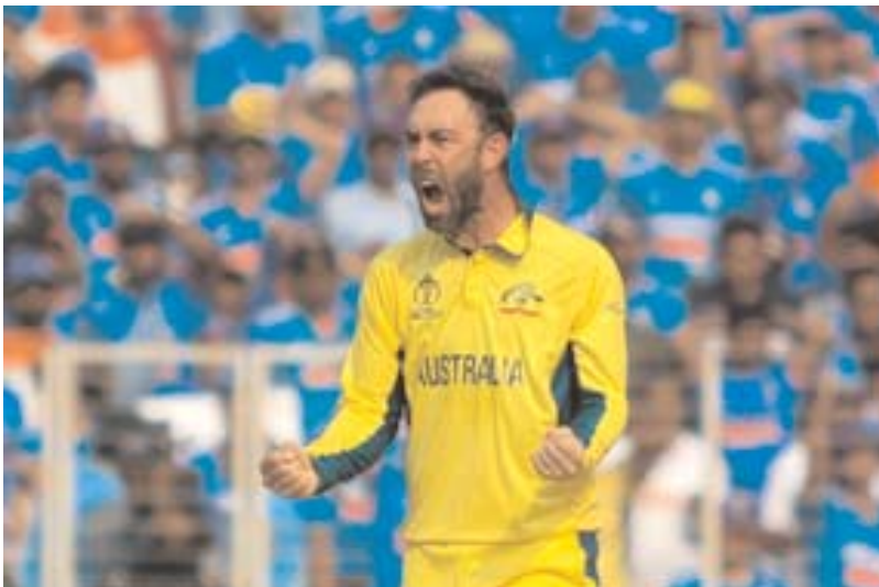
मुझे लगता है कि फाइनल... उससे ऊपर कुछ भी नहीं होने वाला है। टेस्ट क्षेत्र में मैक्सवेल की वापसी का दो बार के वनडे विश्व कप विजेता कप्तान रिची पोर्टिंग ने भी समर्थन किया है। मैं उन्हें उन

फाइनल में दो रन बहुत अच्छे थे। मुझे नहीं लगता कि इससे ऊपर कुछ भी होना वाला है। भले ही टूर्नामेंट के दौरान व्यक्तिगत रूप से कुछ क्षण थे,