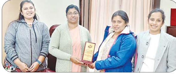
बारहवीं के बाद मिले सीए बनने के टिप्स