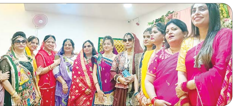
दिग्गंबर जैन महिला परिषद् आदिनाथ शाखा

जबलपुर, देशबन्धु। रजवाड़ी थीम पर महिलाओं ने फैशन का अंदाज दिखाया। किसी ने बड़ी सी नथ के साथ एक्सपेरिमेंट किया, तो किसी ने राजपूताना पोशाक पहनकर रैम्प वॉक की। कलचर और फैशन का यह नजारा अखिल भारतवर्षीय दिग्गंबर जैन महिला परिषद् आदिनाथ शाखा के कार्यक्रम में नजर आया। कार्यक्रम में महिलाओं ने डिफरेंट एक्टिविटी में हिस्सा लिया।