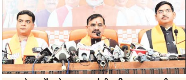
भ्रष्ट नेताओं को बताया गांधी परिवार का एटीएम

भोपाल, देशबन्धु। झारखंड से कांग्रेस के राज्यसभा सदस्य धीरज साहू के टिकानों से करोड़ों रुपये की नकदी बरामद होने पर भाजपा ने कांग्रेस पर निशाना साधा है। पार्टी ने कहा है कि कांग्रेस भ्रष्टाचार की गारंटी है, जबकि प्रधानमंत्री नरेंद्र मोदी भ्रष्टाचारियों को खत्म करने की गारंटी हैं। पार्टी के प्रदेश अध्यक्ष विष्णुदत्त शर्मा ने यहां मीडिया से चर्चा करते हुए कहा कि कांग्रेस के राज्यसभा सांसद धीरज साहू के टिकानों पर पड़े आयकर विभाग के छापों में 200 करोड़ रुपये से अधिक की नगद राशि बरामद हुई है, कार्रवाई जारी है और यह राशि और भी बढ़ सकती है। लेकिन इतने बड़े पैमाने पर नगदी बरामद होना इस बात का सूचक है कि कांग्रेस यदि किसी बात की गारंटी है तो वो केवल भ्रष्टाचार की गारंटी है। कांग्रेस का हाथ भ्रष्टाचारियों के साथ है। उन्होंने कटाक्ष किया कि वोटों की गिनती समाप्त हो गई है, लेकिन वोटों की गिनती जारी है। उन्होंने कहा कि राहुल गांधी जनता को जवाब दें कि उनके पास ऐसे और कितने सांसद हैं जो जनता का पैसा अपने पास जमाखोरी कर बैठें? श्री शर्मा ने कहा कि कांग्रेस नेताओं के भ्रष्टाचार पर गांधी परिवार और कांग्रेस अध्यक्ष की चुप्पी यह बताती है कि कांग्रेसी गांधी परिवार की शह पर भ्रष्टाचार कर रहे हैं। श्री शर्मा ने कहा कि जनता यह अच्छे से जानती है कि कांग्रेस, करण और केश एक-दूसरे के पर्यायवाची हैं। मध्य प्रदेश में भी मिस्टर बंटादार और करणनाथ ने प्रदेश को भ्रष्टाचार का अड्डा बनाया था, इसीलिए कांग्रेस की सरकारों और उनके भ्रष्ट नेता गांधी परिवार के एटीएम कहे जाते हैं। श्री शर्मा ने कहा कि प्रधानमंत्री नरेंद्र मोदी के नेतृत्व में भ्रष्टाचारियों