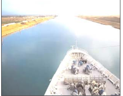
रास्ते होती है। इसके साथ ही पाम ऑयल और अनाज की सप्लाय भी इसी रास्ते होती है।

मार्च 2021 में जब एक बड़ा जहाज छह दिन तक स्वेज नहर में अटक गया था तो ग्लोबल सप्लाय चैन पर संकट खड़ा हो गया था। यह नहर एशिया और यूरोप की लाइफलाइन है। यूरोप को तेल और डीजल की सप्लाय इसी