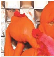
चोरी का मामला सामने आया है। चंदन अलाव चोरों ने हनुमान की मूर्ति में अंतर्भूत लपेट हुए चांदी का नयन की चोरी किया है।

चोरी का मामला सामने आया है। चंदन अलाव चोरों ने हनुमान की मूर्ति में अंतर्भूत लपेट हुए चांदी का नयन की चोरी किया है। इस घटना के बारे में आज सुबह ग्रामीणों को पता चल रहा है। इसके अलावा यहां मूछा मार से लो हो अन्य दो दुकानों में भी चोरी का मामला सामने आया है। इन दो दुकानों में इसके पहिले भी दो से तीन बार चोरी की घटना हो चुकी है। दोनों दुकान के सामने 14 वीं बवालियन कार्यालय संघालित है, इसके अलावा प्रतिदिन चंदन गुरु पुलिस द्वारा पेट्रोलिंग की जा रही है, इसके बाद भी इस तरह चोरी होना सब संभरे है।