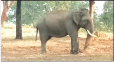
स्थानीय ग्रामीण और प्रकृति प्रेमी नाराज

कसलुद, बलौलाबाबा, 18 दिसम्बर (देशबन्धु)। बलौलाबाबा वनमंडल के अंतर्गत बालनवापरा अध्याय में इन दिनों विभाग ने 2 नर कुमकी को छोड़ दिया है। जहाँ एक ओर इन कुमकी हाथी को धमक से घुमाने वाले पर्यटकों को खूब ताला रही है तो दूसरी ओर इन हाथियों को खलत और चहल कदमी से छोटे बच्चापणी भयभीत व विचलित हो रहे हैं। इस चारागाह में बड़ी संख्या में चीतल और काला हिरण का झुंड स्वतंत्रता विचारण करते देखा जाता रहा है किन्तु अब हाथी को धमक से विचलित हो चला है।