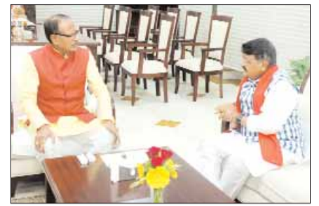
विधायक दल की बैठक से पहले रिविवा को मुख्यमंत्री शिवराज सिंह चौहान से पार्टी महासचिव कैलाश विजयगीरी ने मुलाकात की।

इस बीच राजस्थान में भी अगले मुख्यमंत्री को लेकर सस्पेंस बरकरार है। मुख्यमंत्री के लिए किसी ने चेहरे की संभावनाओं के बीच पूर्व