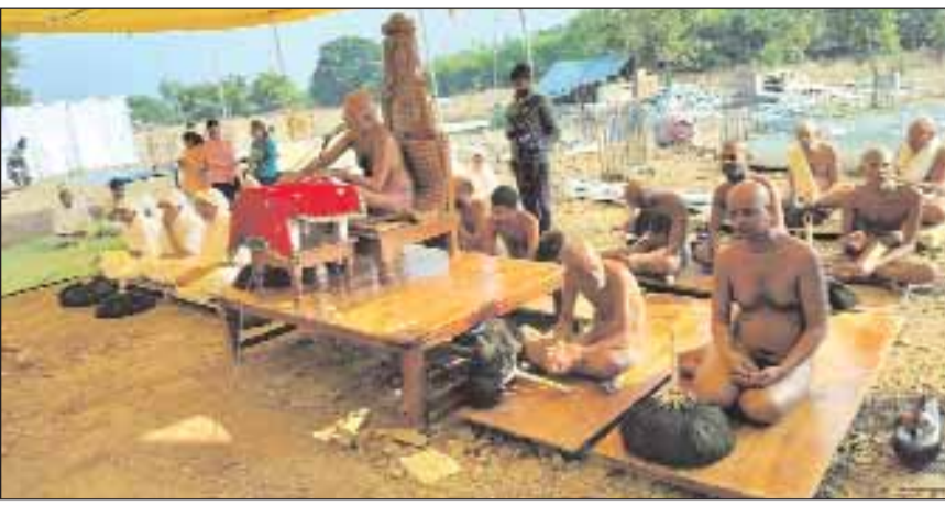
शाहगढ़, देशबन्धु। सिद्ध भूमि नैनागिरि की देशना स्थली पंचकल्याणक महाहोमसव के अंतिम दिन जैन धर्म के प्रथम तीर्थंकर भगवान आदिनाथ को नवप्रभात की नई किरण के साथ कैलाश पर्वत से मोक्ष की प्राप्ति हुई तो तीर्थ स्थल जयकारों से गूंजेन लगा। बड़ी संख्या में यहां मौजूद श्रद्धालु

आदिनाथ ने कैलाश पर्वत से मोक्ष प्राप्त किया, निकली रथयात्रा