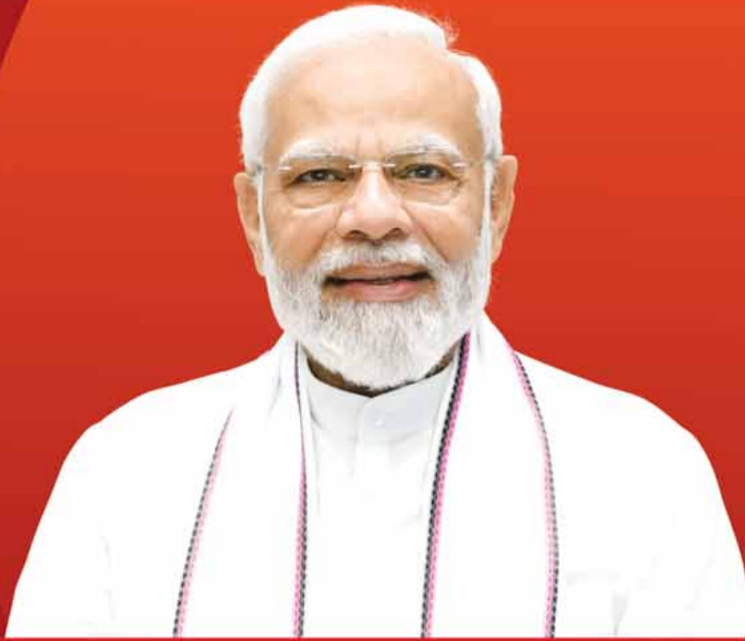
नरेन्द्र मोदी प्रधानमंत्री