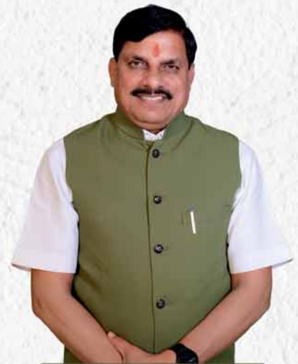
डॉ. मोहन यादव, मुख्यमंत्री

संत शिरोमणि गुरुदेव श्री रविदास जी का स्मारक निर्माण एवं ₹ 150 करोड़ से धरोहर संरक्षण मिशन शुरू करके ऐतिहासिक स्मारकों का नवीनीकरण सभी जनजातीय नायकों के भव्य स्मारकों का निर्माण 13 सांस्कृतिक लोकों का निर्माण नमामि नर्मदे परियोजनाएं शीघ्र होंगी पूर्ण ₹ 7,500 करोड़ के निवेश के साथ 2 लाख युवाओं को पर्यटन के क्षेत्र में प्रशिक्षण, रोजगार तथा स्वरोजगार के अवसर