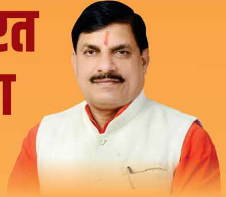
डॉ. मोहन यादव मुख्यमंत्री