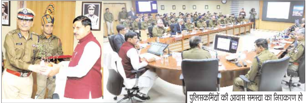
पुलिसकर्मियों की आवास समस्या का निराकरण हो

भोपाल, देशबन्धु। जिन जिलों में अपराध दर ज्यादा है, उन जिलों के लिए व्यापक स्तर पर कार्य योजना बनाई जाए, अवैध हथियारों की तस्करी को रोकने प्रभावी कार्यवाही की जाए, वहीं शराब माफिया पर अंकुश लगाने सतत कार्यवाही करें, खनिज विभाग से समन्वय स्थापित कर खनिज माफिया के खिलाफ सख्त कदम उठाएं।