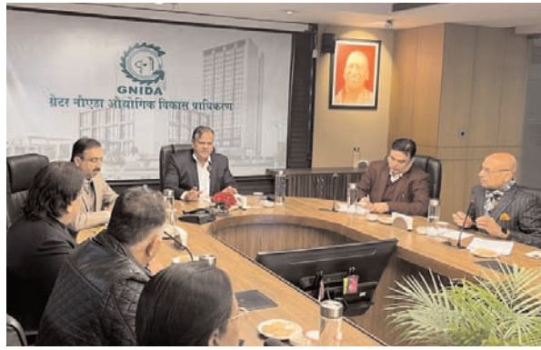
■ औद्योगिक विकास आयुक्त ने ग्रेटर नोएडा में बिल्डरों के साथ की बैठक

ग्रेटर नोएडा, 7 जनवरी (देशबन्धु)। ग्रेटर नोएडा प्राधिकरण की 52 परियोजनाओं के बिल्डर अमिताभ कांत समिति की सिफारिशों का लाभ लेने के लिए तैयार हैं। अगले दो दिन में ये बिल्डर अपनी सहमति दे देंगे। इसके बाद पुनर्वास पैकेज लागू करने की कार्रवाई शुरू हो जाएगी। बिल्डर-बायर्स मद्दे को हल करने के लिए नीति आयोग के पूर्व सीईओ अमिताभ कांत समिति की सिफारिशों को लागू करने के लिए कार्रवाई तेज हो गई है। ग्रेटर नोएडा प्राधिकरण क्षेत्र में 96 परियोजनाओं में करीब 72 हजार प्लैट बायर्स फंसे हैं। इन पर करीब 5500 करोड़ रुपए बकाया है। सिफारिशों को लागू कराने के लिए रिविवा को ग्रेटर नोएडा प्राधिकरण में अवस्थाना एवं औद्योगिक विकास आयुक्त मनोज कुमार सिंह