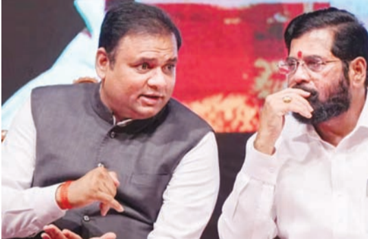
नावकर से मिले मुख्यमंत्री एकनाथ शिंदे उधर, स्पीकर नावकर ने अपने फैसले सुनाने की डेडलाइन से पहले

मुंबई, 9 जनवरी (एजेंसियां)। महाराष्ट्र के मुख्यमंत्री एकनाथ शिंदे और उनके समूह के 16 विधायकों अयोग्यता पर बुधवार 10 जनवरी को विधानसभा अध्यक्ष राहुल नावकर फैसला करेंगे।