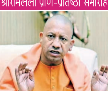
श्रीरामलला प्राण-प्रतिष्ठा समारोह

लखनऊ, 9 जनवरी (देशबन्धु)। मुख्यमंत्री योगी आदित्यनाथ ने अयोध्याधाम में बहुप्रतीक्षित श्रीरामलला के नवीन विग्रह की प्राण-प्रतिष्ठा समारोह से आम जनमानस के भावनात्मक जुड़ाव को देखते हुए 22 जनवरी को प्रदेश में शिक्षण संस्थाओं में अवकाश घोषित करने के निर्देश दिए हैं।