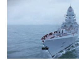
पाकिस्तानी नौसेना का कहना है अरब सागर में हालिया घटनाओं के बाद पाकिस्तान ने ये युद्धपोत तैनात किए हैं।

नई दिल्ली, 9 जनवरी (एजेंसियां)। भारत ने अरब सागर में समुद्री निगरानी बढ़ा दी है। भारतीय नौसेना ने समुद्री डाकूओं और अपहरण की घटनाओं को देखते हुए यहां 10 युद्धपोत तैनात किए हैं।