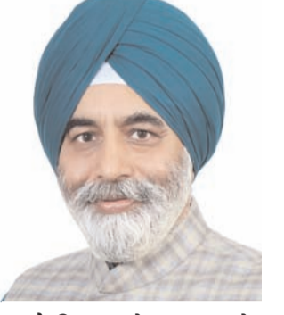
लैंडफिल साइटों पर कूड़ा बढ़ने पर साधा निशाना