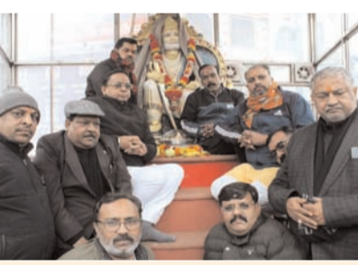
श्री हनुमान शोभायात्रा समिति करेगी 5100 दौरे का वितरण 21 जनवरी तक धानेश्वर चौक पर कर सकेंगे श्रद्धालु दर्शन

मेरठ, 9 जनवरी (देशबन्धु)। श्री हनुमान शोभायात्रा समिति (रंज.) मेरठ छावनी की टीम मंगलवार को अयोध्या से अखंड ज्योति लेकर मेरठ पहुंची। अखंड ज्योति धानेश्वर चौक स्थित महाराजा अग्रसेन मंदिर में स्थापित की गई जहां 21 जनवरी तक श्रद्धालु दर्शन कर सकेंगे। इसको लेकर मंगलवार को धानेश्वर चौक स्थित धानेश्वर मंदिर में प्रेसवार्ता की गई। गौरतलब है कि समिति मेरठ छावनी क्षेत्र में गत 33 वर्षों से विशाल एवं भव्य शोभायात्रा का आयोजन करती आ रही है। प्रेसवार्ता में जानकारी दी गई कि श्री हनुमान शोभायात्रा समिति की टीम चार दिन पहले अयोध्या गई थी जो कल टेन से चलकर