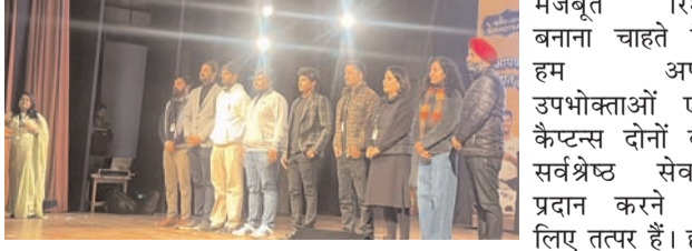
मजबूत रिश्ते बनाना चाहते हैं। हम अपने उपभोक्ताओं एवं कैप्स दोनों को सर्वश्रेष्ठ सेवाएं प्रदान करने के लिए तत्पर हैं। हम जियो कमीशन के साथ रैपिडो कैप्स लेकर आए हैं ताकि