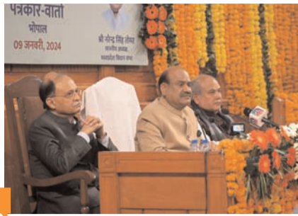
सभा की गरिमा का हनन किए जाने की घटनाओं के मामले में कड़े कदम उठाए जाने की जरूरत है : ओम बिरला

भोपाल, 9 जनवरी (देशबन्धु)। लोकसभा अध्यक्ष ओम बिरला ने मंगलवार को कहा कि नियोजित तरीके से सदन में व्यवधान पैदा करने की जो एक नई परंपरा चल गई है, उसे समाप्त करने की आवश्यकता है। इसके साथ ही उन्होंने सदन में कानून बनाने के दौरान संबंधित विषय पर विस्तार से चर्चा होने की जरूरत भी बताई। बिरला यहां मध्य प्रदेश विधानसभा के नव-निर्वाचित विधायकों के लिए आयोजित दो दिवसीय प्रबोधन कार्यक्रम के उद्घाटन सत्र को संबोधित कर रहे थे। इस दौरान मध्य प्रदेश विधानसभा अध्यक्ष नरेंद्र सिंह तोमर, मुख्यमंत्री डॉ.मोहन यादव, नेता प्रतिपक्ष उमंग सिंघार और संसदीय कार्य मंत्री कैलाश विजयवर्गीय ने भी अपना संबोधन दिया। इस अवसर पर अपने विचार व्यक्त करते हुए बिरला ने विधायी निकायों में अनुशासन और शालीनता में लगातार आ रही गिरावट पर चिंता व्यक्त की। लोस अध्यक्ष ने कहा कि सभा की गरिमा का हनन किए जाने की घटनाओं के मामले में कड़े कदम उठाए जाने की जरूरत है। गंभीर बहस और चर्चा के मंच के रूप में विधानमंडलों के महत्व पर जोर देते हुए बिरला ने कहा कि सभागृह में कुछ हद तक गरमागर्मा, शोर-शराबा और हेमामा होना स्वाभाविक है, लेकिन अक्सर गरमागर्मा बहस से सभा में अशांति और अयुक्तता होने से अराजकता पैदा हो जाती है जिससे समय और संसाधनों की हानि होती है और लोगों में विधानमंडलों की विश्वसनीयता कम होती है। इस बात का उल्लेख करते हुए कि नियोजित