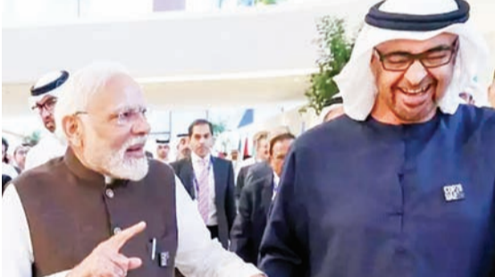
वाइब्रेंट गुजरात ग्लोबल समिट में हिस्सा लेने गुजरात पहुंचे

अहमदाबाद, 9 जनवरी (देशबन्धु)। प्रधानमंत्री नरेंद्र मोदी और संयुक्त अरब अमीरात (यूएई) के राष्ट्रपति मोहम्मद बिन जायद अल नाहयान ने मंगलवार को अहमदाबाद में रोड शो किया।