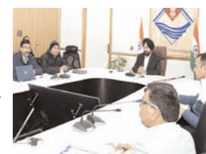
मुख्यसचिव ने ती अधिकारियों की बैठक

देहरादून, 17 जनवरी (देशबन्धु)। प्रदेश में भूस्वखलन एक बड़ी समस्या रही है और शायद इसलिए राज्य सरकार ने प्रदेश में लैंडस्लाइड मिटिंगेशन एंड मैनेजमेंट सेंटर की स्थापना की है। मुख्य सचिव डा. एसएस संधु ने सचिवालय में इसको लेकर आगामी 5 सालों की कार्य योजना पर अधिकारियों के साथ चर्चा की और जरूरी दिशा निर्देश भी दिए। उत्तराखण्ड में हर साल भूस्वखलन से सैकड़ों करोड़ का नुकसान होता है, यही नहीं इसके कारण मानव क्षति भी राज्य के लिए एक बड़ी परेशानी बनती है। हिमालय राज्य उत्तराखण्ड भूस्वखलन के लिहाज से बेहद संवेदनशील भी है। ऐसे में ऐसी प्राकृतिक घटनाओं पर शोध और अध्ययन के साथ ही इसके लिए बेहतर कार्य करने को लेकर