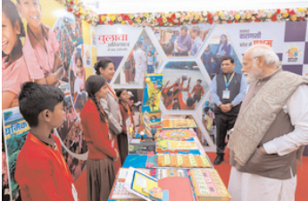
■ प्रधानमंत्री ने 15 नवम्बर 2023 को की थी विकसित भारत संकल्प यात्रा की शुरुआत

लोगों की यह विशाल भागीदारी एक उन्नतिशील और समावेशी भारत की दिशा में संगठित मार्ग बनाने के लिए यात्रा की तोर्रता के बारे में बहुत कुछ बताती है। विकसित भारत संकल्प यात्रा एक ऐतिहासिक पहल है, जिसका उद्देश्य पूरे देश में सरकारी योजनाओं की 100 प्रतिशत परिपूर्णता सुनिश्चित करना है। राजस्थान, मध्य प्रदेश, छत्तीसगढ़ और तेलंगाना राज्यों में अभियान शुरू होने के बाद लोगों की