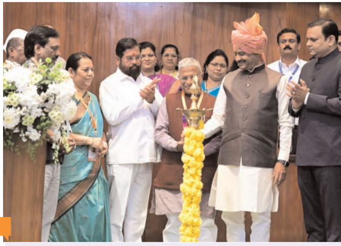
कार्यपालिका की अधिक जवाबदेही के लिए विधानमंडलों में काम करने के जल तौर-तरीकों को बढ़ावा दिया जाना चाहिए : ओम बिरला

है कि इन मुद्दों पर आम सहमति होने के बावजूद, हम अभी तक सदन के सुचारू कामकाज के लिए अपनी प्रतिबद्धताओं को लागू नहीं कर पाए हैं। इस बात पर जोर देते हुए कि जन प्रतिनिधियों का आचरण संसदीय मर्यादाओं के अनुरूप होना चाहिए। बिरला ने सदस्यों से सदन में अपना समय रचनात्मक कार्यों में लगाने का आग्रह किया।