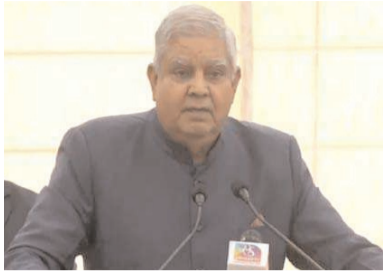
युवकों में नशा करने की प्रवृत्ति से मुक्ति की दिशा में हरियाणा के अखाड़े बेहतरीन काम कर रहे हैं : जगदीप धनखड़

नई दिल्ली, 3 फरवरी (एजेंसियां)। उपराष्ट्रपति जगदीप धनखड़ ने शनिवार को कहा कि खाप संस्कृति 'हमारी सभ्यता की गहराई का प्रतीक है' और इक्की दुक्की घटनाओं से इनका आकलन नहीं किया जा सकता। धनखड़ ने हरियाणा के फरीदाबाद में कहा कि खाप की भूमिका सकारात्मक है और इक्की दुक्की घटनाओं से इनका मूल्यांकन नहीं किया जा सकता। उप राष्ट्रपति ने हरियाणा सरकार की नौ वर्षों की उपलब्धियों पर पुस्तक का विमोचन करते हुए हरियाणा के अखाड़ों और गुरुओं की बहुत प्रशंसा की। इस अवसर पर हरियाणा के राज्यपाल बंडारू दत्तात्रेय, मुख्यमंत्री मनोहरलाल, हरियाणा विधान सभा