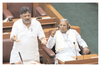
कर्नाटक के उपमुख्यमंत्री डी.के. शिवकुमार ने एक मट के पुजारी के आरोपों पर बयान जारी कर कहा कि राज्य

बेंगलुरु, 3 फरवरी (एजेंसियां)। कर्नाटक के उपमुख्यमंत्री डी.के.शिवकुमार ने कहा कि कांग्रेस सरकार कर्नाटक में सूखे की स्थिति से निपटने के लिए केंद्र सरकार द्वारा धन आवंटित न करने को लेकर 7 फरवरी को नई दिल्ली में विरोध-प्रदर्शन करेगी। उन्होंने कहा कि विरोध-प्रदर्शन का नेतृत्व मुख्यमंत्री सिद्दारमैया करेंगे और सभी मंत्री और कांग्रेस विधायक इसमें भाग लेंगे। उपमुख्यमंत्री ने मीडियाकर्मियों से कहा कि हम कर्नाटक के लिए न्याय की मांग करेंगे। कर्नाटक में 200 से अधिक तालुक सूखाग्रस्त हैं और केंद्र सरकार द्वारा कोई धन आवंटित नहीं किया गया है। उन्होंने कहा कि पिछले बजट में घोषित धनराशि राज्य को जारी नहीं की गई है और वर्तमान बजट में भी राज्य के हितों को कमतर आंका गया है। उपमुख्यमंत्री ने कहा कि पूरी कर्नाटक सरकार इस मुद्दे पर पहली बार राष्ट्रीय राजधानी में विरोध-प्रदर्शन करेगी।