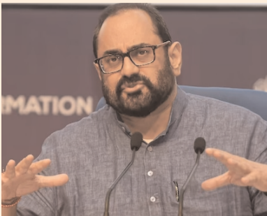
डिजिटल इंडिया फ्यूचरलैब्स एक वास्तुकला में एक रूपरेखा का आखिरी टुकड़ा है, जिसे हमारे प्रधानमंत्री नरेंद्र मोदी ने बहुत पहले एक साथ रखा था- चंद्रशेखर

चंद्रशेखर ने इंटरप्रस्थ इंस्टीट्यूट ऑफ इंफॉर्मेशन टेक्नोलॉजी (आईआईआईटी) दिल्ली में कहा, ‘डिजिटल इंडिया फ्यूचरलैब्स एक वास्तुकला में एक रूपरेखा का आखिरी टुकड़ा है, जिसे हमारे प्रधानमंत्री नरेंद्र मोदी ने बहुत पहले एक साथ रखा था। इसकी शुरुआत 2015 में ‘डिजिटल इंडिया’ लॉन्च के साथ हुई और कई सालों तक भारत को दुनिया के