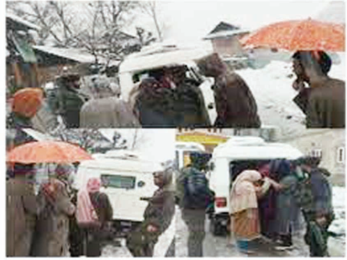
चिकित्सा उपचार के लिए पीएचसी डांगीवाचा पहुंचाया।

पिछले दो दिन में भारी बर्फबारी के कारण सड़क पूरी तरह से अवरुद्ध हो गई है और वाहनों की आवाजाही बहुत मुश्किल हो गई है। पुलिस ने कहा कि एसएचओ डांगीवाचा के नेतृत्व में एक पुलिस दल तुरंत मौके पर पहुंच गया। खतरनाक सड़कों सहित कठिन परिस्थितियों के बावजूद बचाव दल ने गर्भवती महिला को सरकारी वाहन में तत्काल