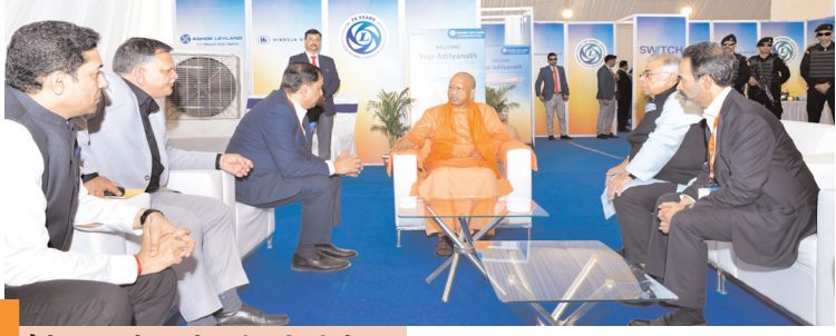
जैसे इन इन्वेस्टर फ्रेंडली पॉलिसी लेकर आए, वैसे ही इन्वेस्टर्स को भी निवेश पब्लिक फ्रेंडली बनाएँ : योगी आदित्यनाथ

लखनऊ, 20 फरवरी (देशबन्धु)। मुख्यमंत्री योगी आदित्यनाथ ने मंगलवार को लखनऊ में अशोक लीलेंड की इलेक्ट्रिक वाहन फैक्ट्री के भूमिपूजन कार्यक्रम में हिस्सा लिया। यहां उन्होंने कहा कि हिंदुजा ग्रुप के प्रकाश और अशोक ने अभी मुझे